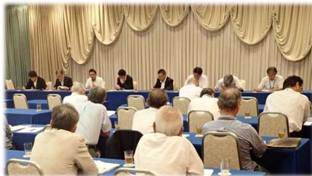
土地改良相談開設