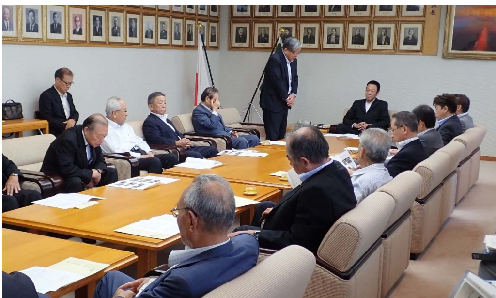
本会大山会長による要望説明