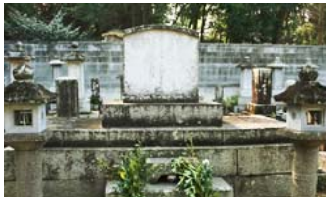
平田与一左衛門の墓