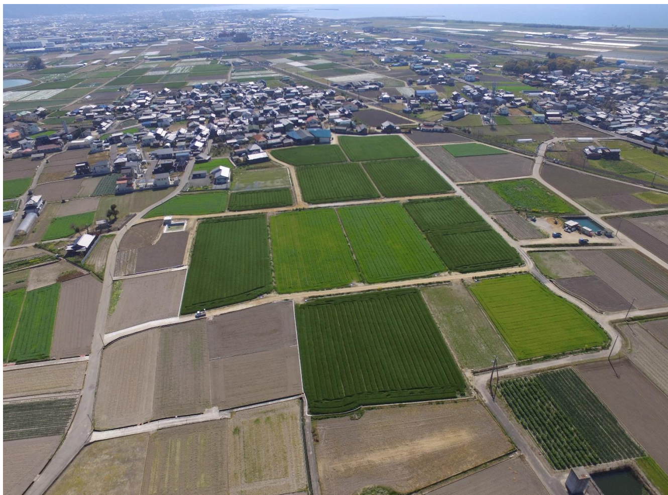
農地耕作条件改善事業油井北側地区（観音寺市柞田町）

発行所 香川県土地改良事業団体連合会 高松市番町五丁目1番29号 TEL (087) 832-7140 FAX (087) 832-7150 http://www.midorinet-kagawa.or.jp/