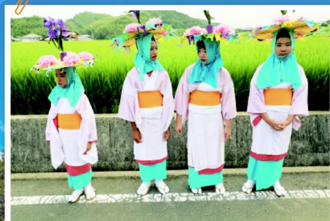
第18回 最優秀賞【まつりの日】