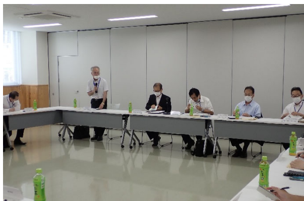
高松法務局 安藤首席登記官による挨拶

同委員会では、換地及び農地の利用集積に係る諸課題について検討を行い、担い手の育成や規模拡大に向けた施策等について協議した。なお、下記協議事項については、原案どおり承認された。