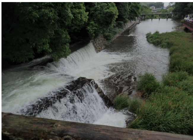
壮観なゆる抜き風景