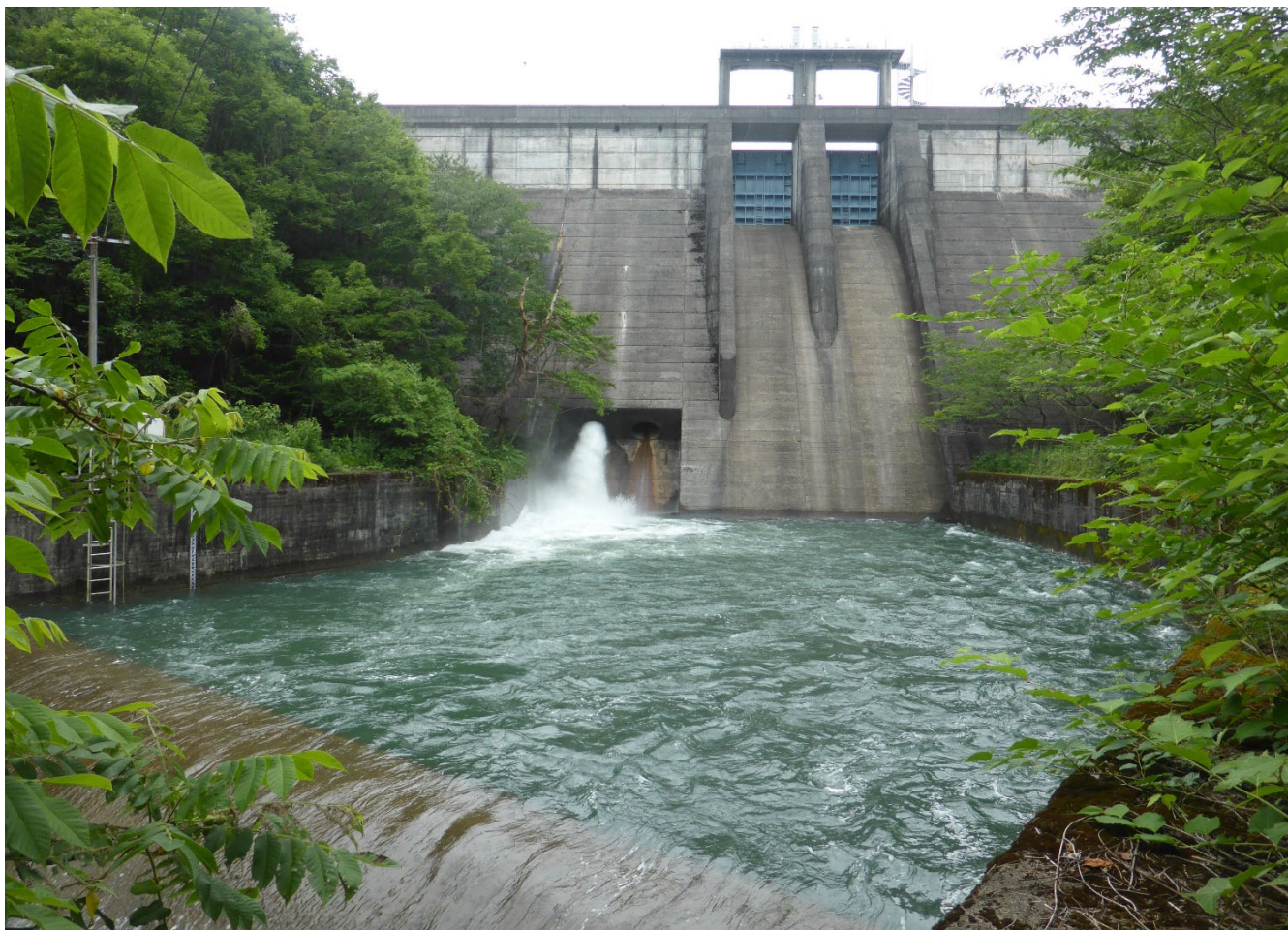
野ロダムの放流（まんのう町塩入）

発行所 香川県土地改良事業団体連合会 高松市番町五丁目1番29号 TEL (087) 832-7140 FAX (087) 832-7150 http://www.midorinet-kagawa.or.jp/