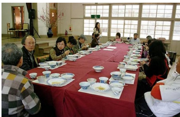
地元の食材を調理し「まんぷく会」を開催

奥塩江交流ボランティア協会は、現在会員100名を超え、ホームページ及びブログでイベントの告知や活動を報告しており、「モノの広場」と名付けた交流の場において、地元で採れた食材を使った調理・食事会の開催、また、高冷地の特徴を生かした高品質な塩江茶を栽培し販売するなど、幅広い活動を行っている。