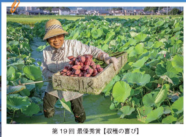
第19回 最優秀賞【収穫の喜び】