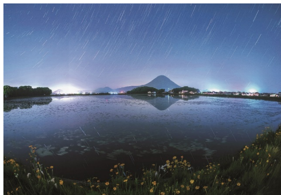
特別賞「星の射す水面」 宮池（香川県丸亀市）