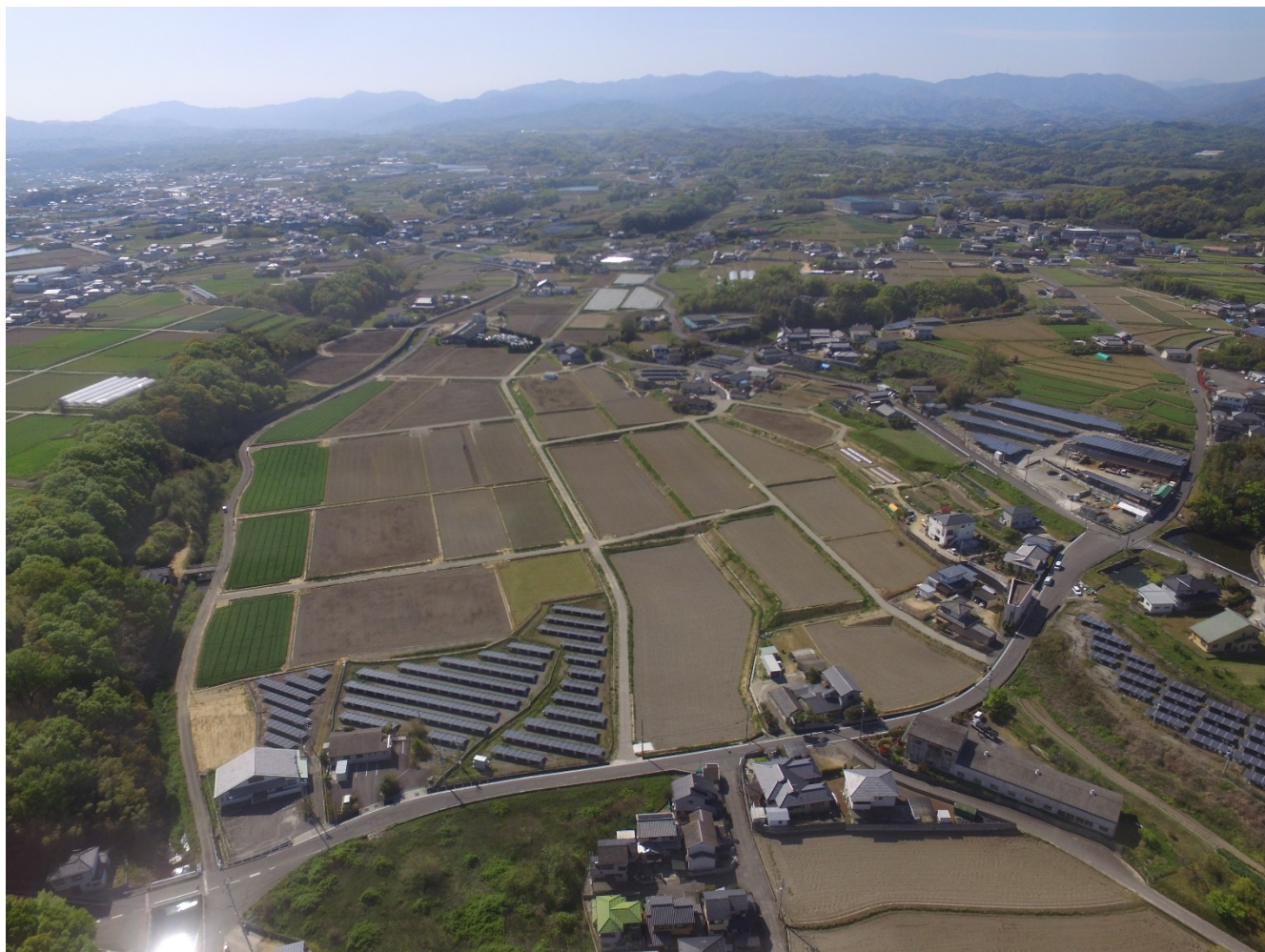
農業基盤整備促進事業西庄北部地区（高松市香南町）

発行所 香川県土地改良事業団体連合会 高松市番町五丁目1番29号 TEL (087) 832-7140 FAX (087) 832-7150 http://www.midorinet-kagawa.or.jp/