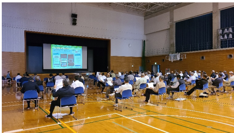
観音寺市での防災重点農業用ため池保全管理説明会の様子

「7. ハザードマップ等の活用について」では、ハザードマップや浸水想定区域図を活用した避難訓練等について、事例を示しながら説明があり、併せて多面的機能支払交付金の共同活動「防災・減災力の強化」の活用について説明があった。このほか、多面的機能支払制度も活用して、地域住民の皆さんとともに地域ぐるみでため池を守ってほしいとの話があり、本会も「多面的機能支払制度のPRブース」を設け、新規取組の促進を行った。