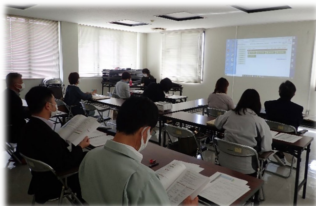
5月11日 仲多度支所会議室

で必要な仕訳を自動で作成（二次仕訳）し、二次仕訳より、貸借対照表や正味財産増減計算書を自動で作成する。