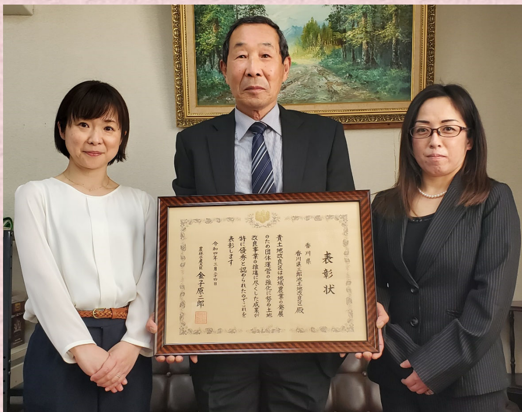
香川県三郎池土地改良区