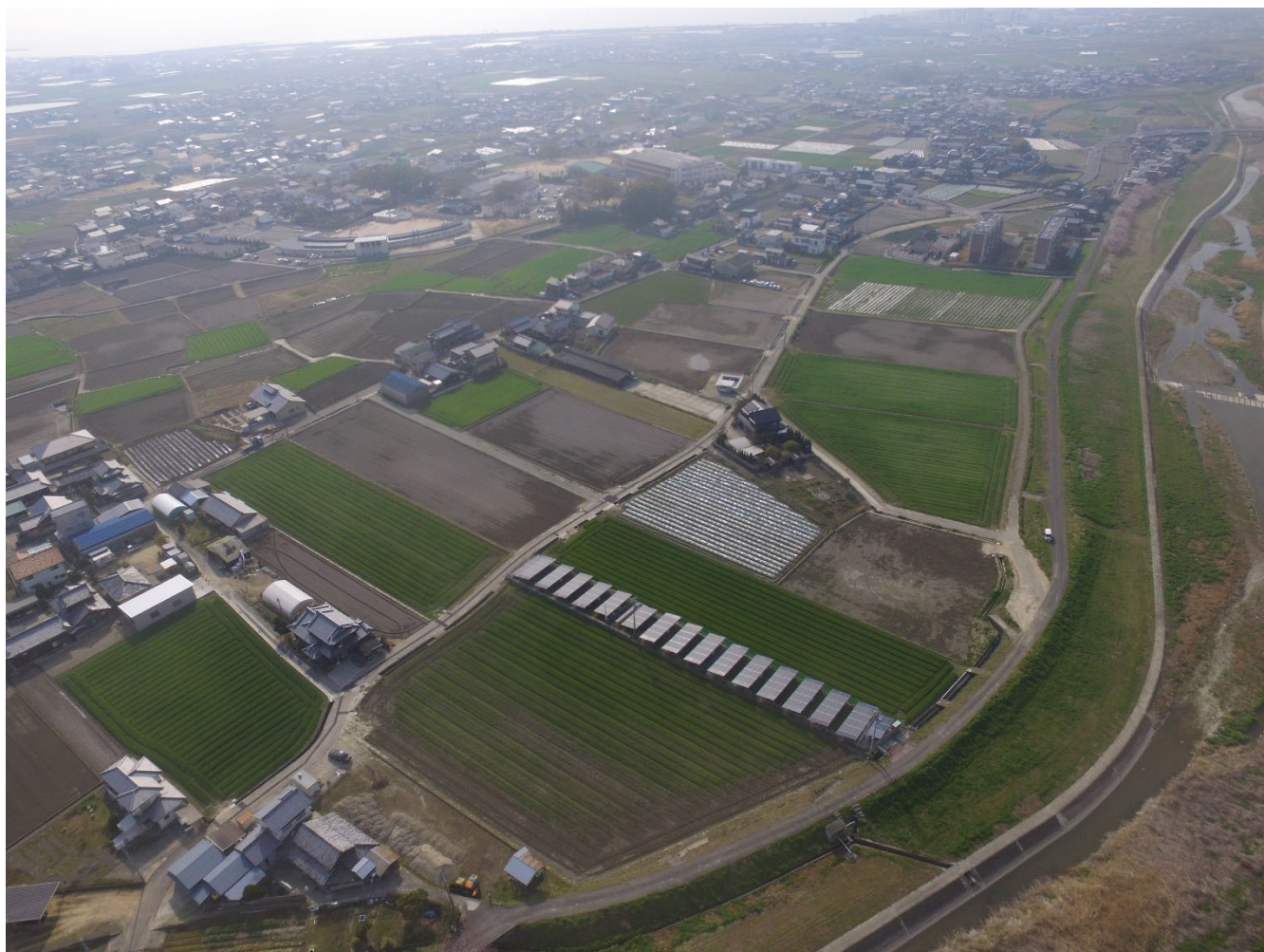
農地耕作条件改善事業寺井地区（観音寺市柞田町）

発行所 香川県土地改良事業団体連合会 高松市番町五丁目1番29号 TEL (087) 832-7140 FAX (087) 832-7150 http://www.midorinet-kagawa.or.jp/