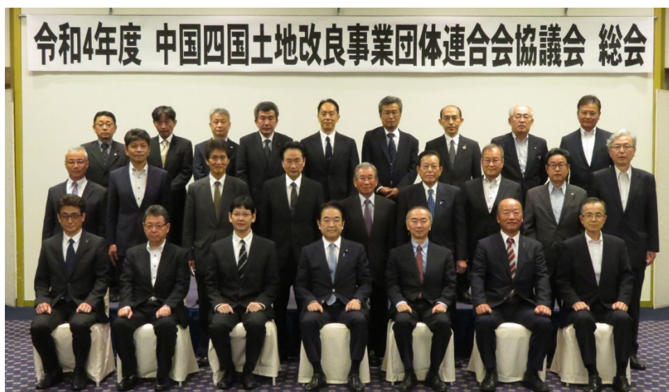
中国四国土地改良事業団体連合会協議会総会出席者