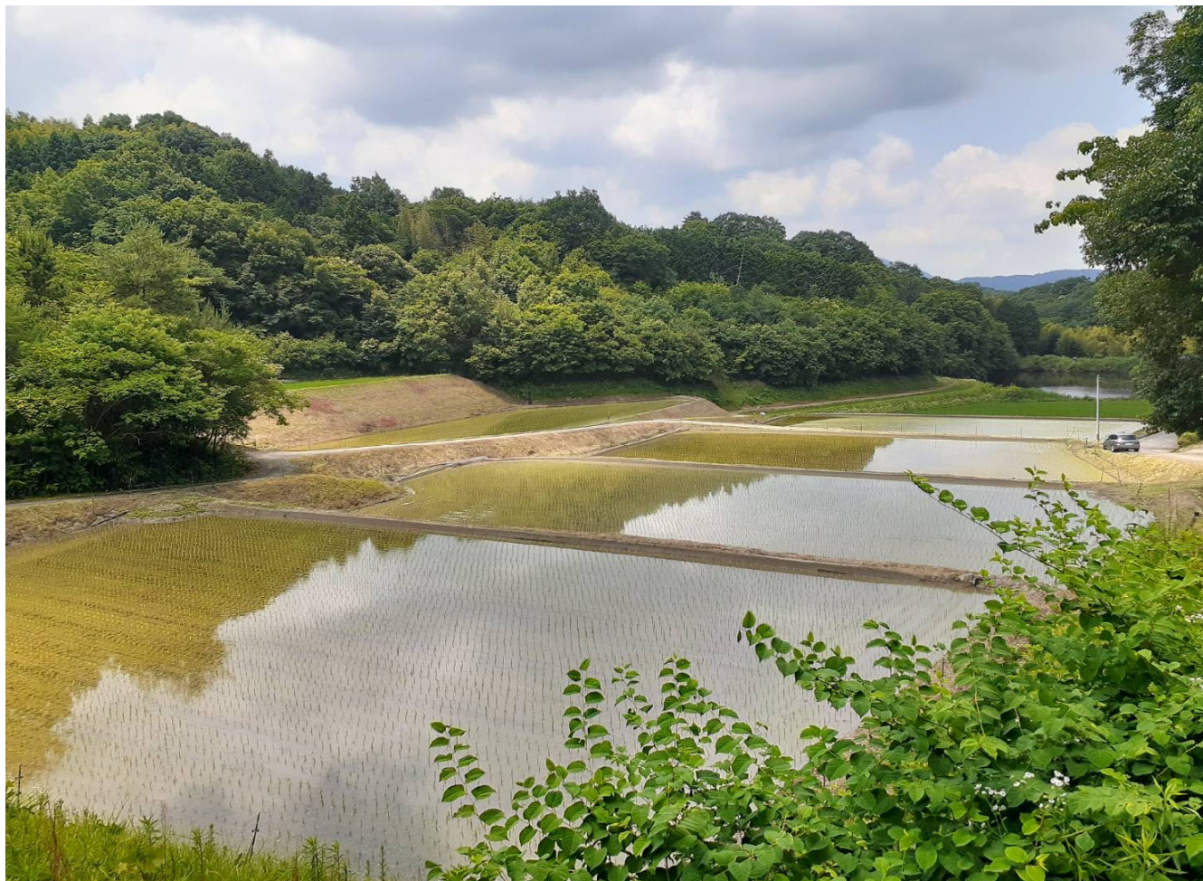
「引土池」周辺の棚田（高松市香川町東谷）