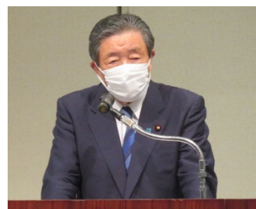
森山裕自民党 TPP・日EU・日米 TAG 等 経済協定対策本部長による祝辞