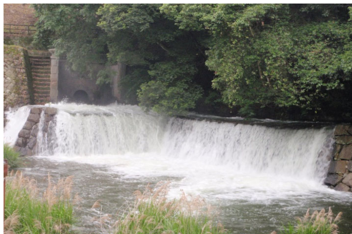
壮観なゆる抜き風景

正午に水門が開放されると、ごう音とともに勢いよく水が流れ出し、細かなしぶきが飛んで周囲を涼やかな空気で包み込んだ。放水