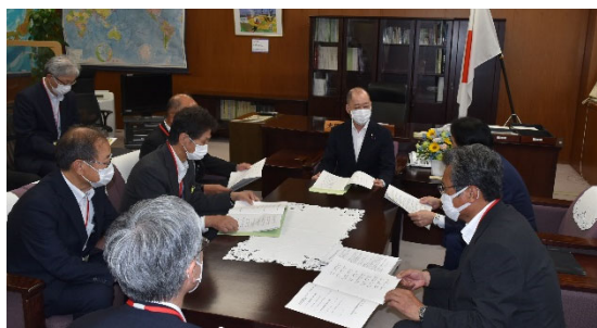
官崎雅夫農林水産大臣政務官に要請