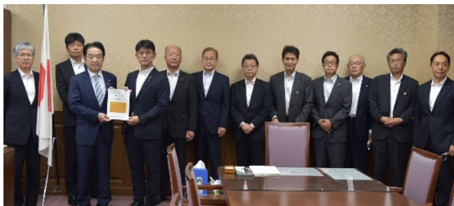
高村正大財務大臣政務官に要請