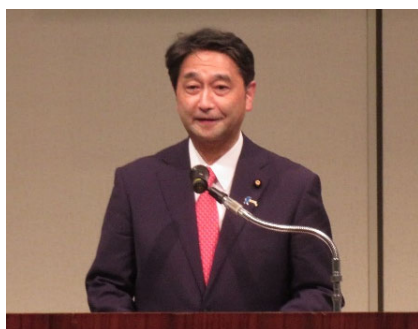
進藤金日子参議院議員による 情勢報告