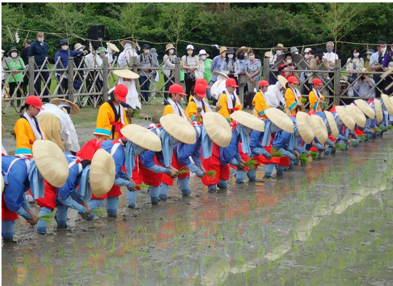
主基斎田 お田植えまつり（綾歌郡綾川町）