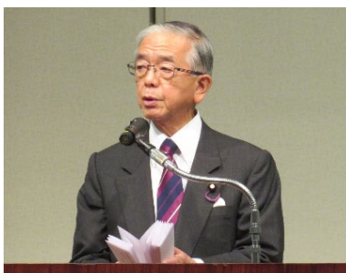
金子原二郎農林水産大臣による祝辞