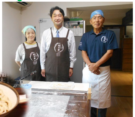
農林漁家民宿「 稲木家 」で農家体験