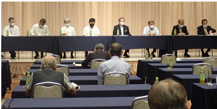
中部地区土地改良相談