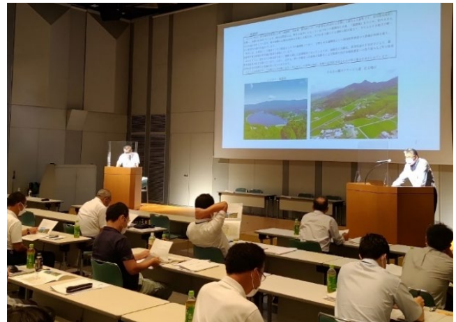
合併事例発表の様子

その後のパネルディスカッションでは、まんのう町土地改良区池田局長より合併前の旧改良区に未加入地域があり、加入の推進と合併のどちらを優先すべきかの協議もあったが、結果的に合併を優先し、未加入地域の加入については、基盤整備等の土地改良事業の推進に併せて継続し進めることとなったと合併の流れについての説明があった。