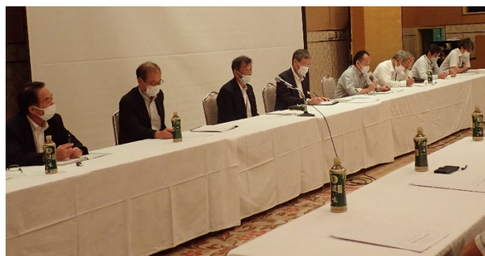
西讃管内土地改良相談