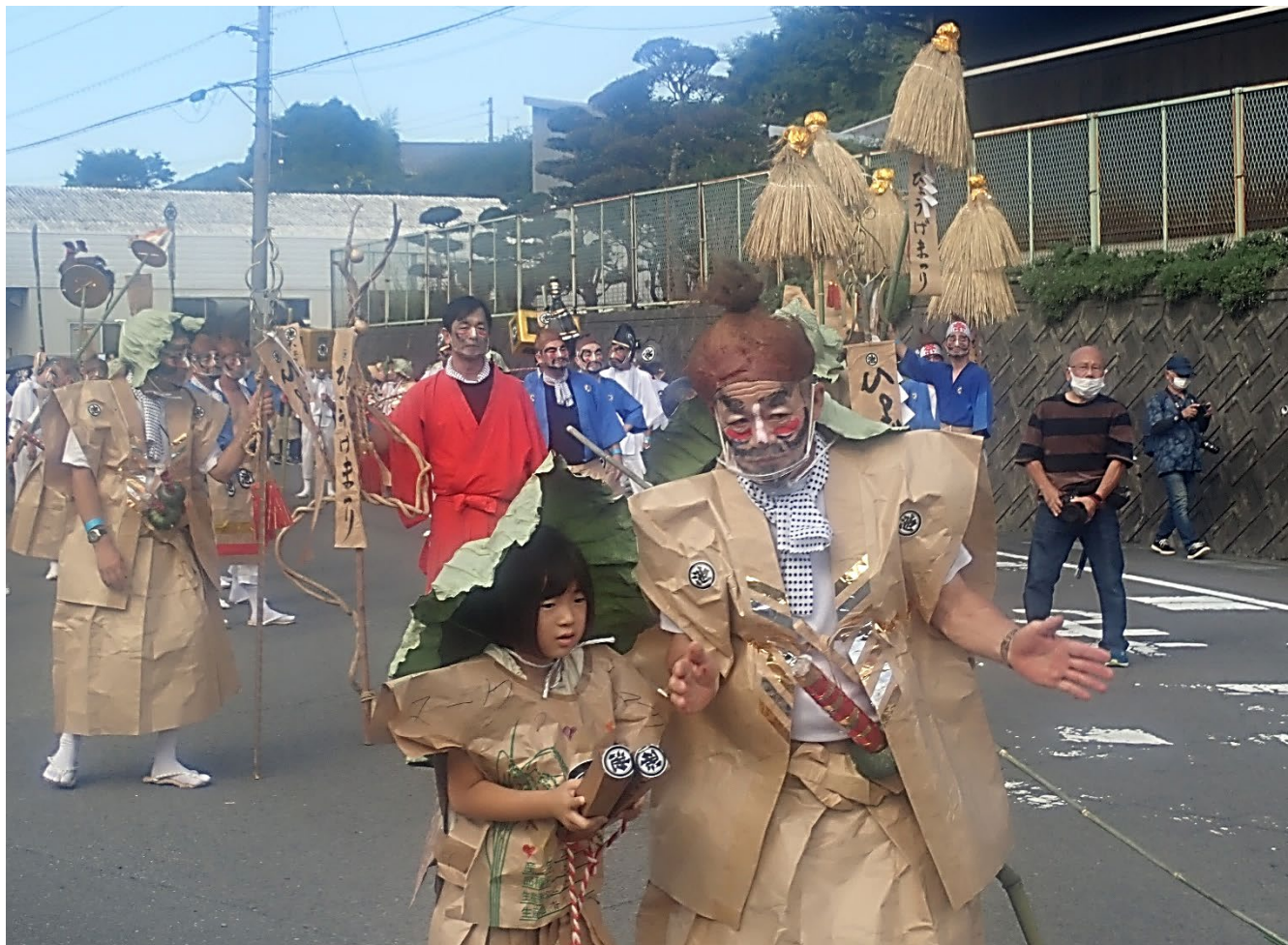
ひょうげまつり（高松市香川町浅野）