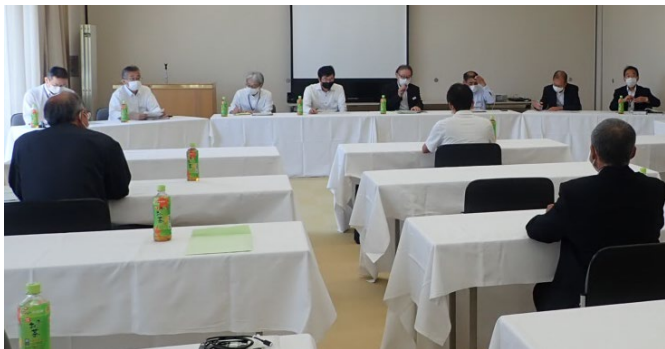
大川地区土地改良相談

土地改良相談では、令和2年12月に閣議決定された「第5次男女共同参画基本計画」における土地改良区の女性理事登用の成果目標や、女性理事登用に関する課題について、また、令和4年度より単式簿記から複式簿記への移行となった土地改良区の令和4年度以降の複式簿記会計の理事会・総代会での決算説明の手順についての質問が挙げられたほか、居所不明組合員への賦課徴収等についても挙げられ、各土地改良事務所長をはじめとした、知識と経験が豊富な相談員がこれらの質疑応答に当たり、各相談事項に対し回答がなされた。