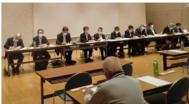
中讃管内土地改良相談