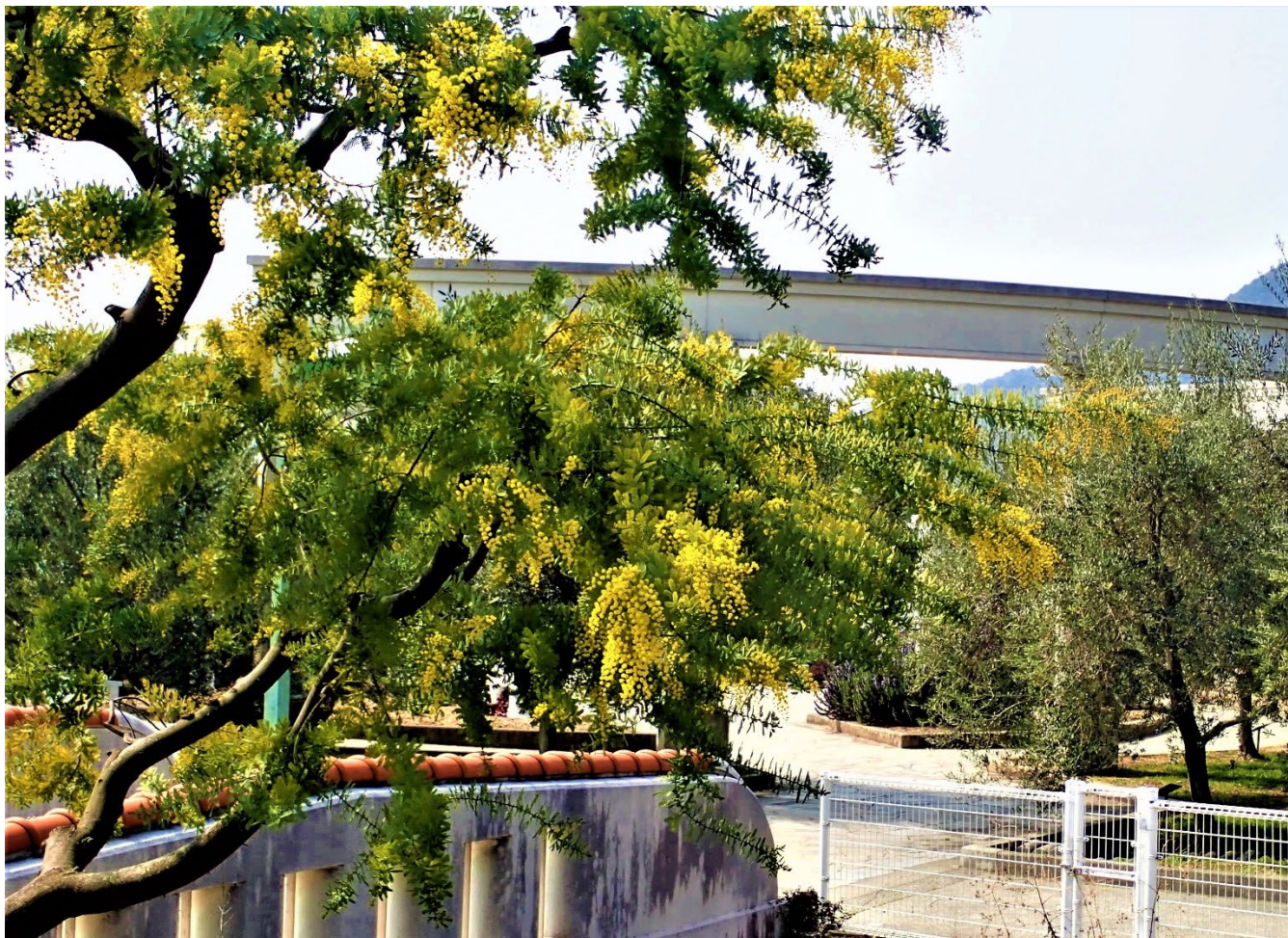
見頃を迎える小豆島オリーブ公園のミモザ（小豆郡小豆島町）