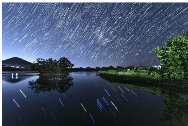
「恵水は星を湛える」 高崎 彰