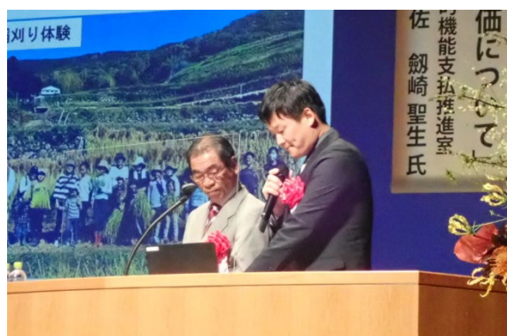
中山地域活動組織による事例発表