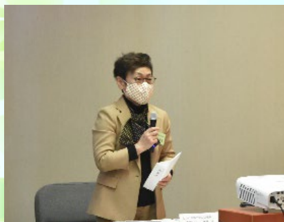
檀床会長による挨拶

この会は、中国四国管内の水土里ネット女性の会等を会員とし、会員相互の親睦を深めるとともに、情報交換や学習、提言、広報・啓発活動、災害支援などを共に行動することにより、女性がより一層活躍できる環境作りを進めることを目的として活動を行なっていくものである。