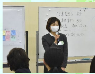
かがわ水土里ネット女性の会 大林副会長