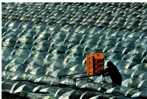
「ハウス模様」 石角尚義