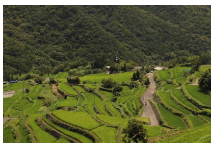
「広がる棚田」前川 梓