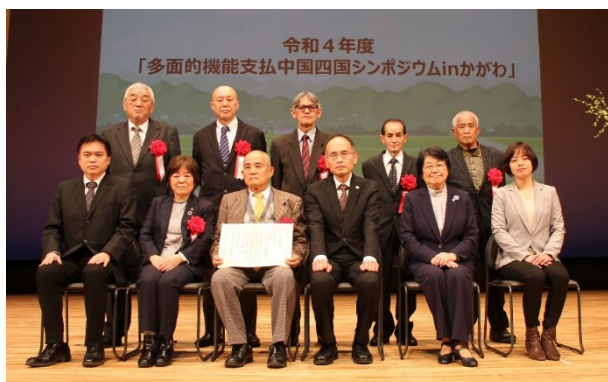
農政局長表彰受賞者