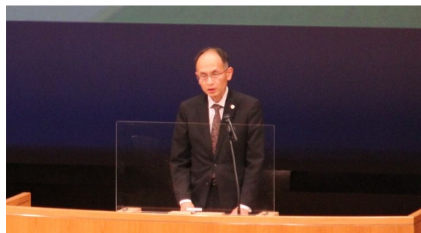
山本中国四国農政局長の挨拶