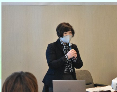
柵木次長による講演