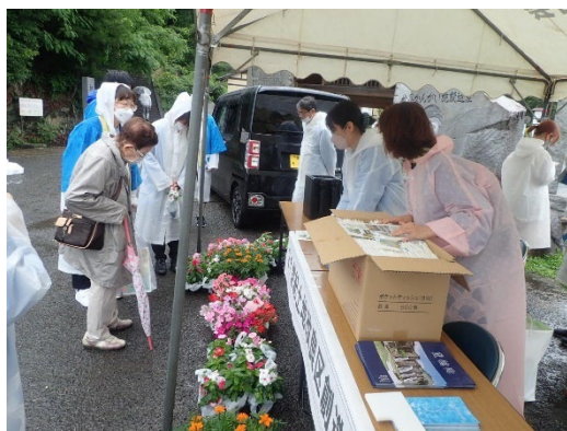
かがわ水土里ネット女性の会の活動の様子