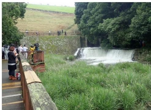
壮観なゆる抜き風景

正午に水門が開放されると、ごう音とともに勢いよく水が流れ出し、細かなしぶきが飛んで周囲を涼やかな空気で包み込んだ。