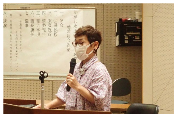
講演する檀床会長