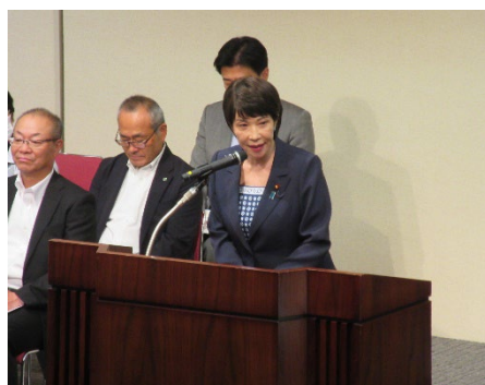
高市早苗大臣による祝辞