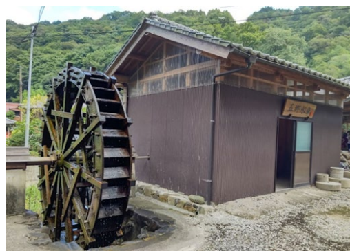
復活した五郷水車

五郷里づくりの会は、農山村として持続の可能性が問われてきていた五郷地区において、こうした状況を食い止めるため地域づくりの勉強会を重ね、平成23年度に地域活性化活動の母体となる組織として発足した。そして、ホームページの作成やFacebookの活用方法を習得するとともに、シンポジウムやワークショップの開催、地域活性化のシンボルとなる「五郷水車」の復活、また自作のピザ窯でのピザづくり体験や里山歩きツアーなどのグリーン・ツーリズム事業にも取り組み、これらを五郷里づくり新聞、Facebook、ホームページなどにより、会の活動を地域内外に向け積極的に発信しており、今回の受賞はこれらの活動に係る広報が高く評価されたものである。