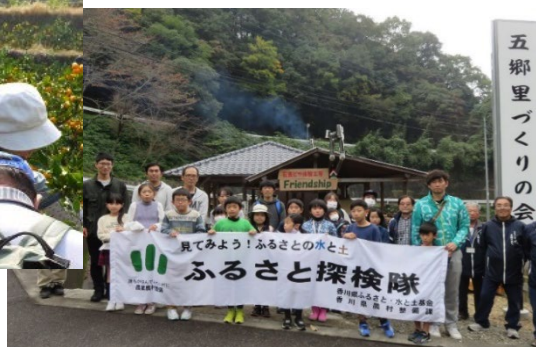
親子連れの体験イベント