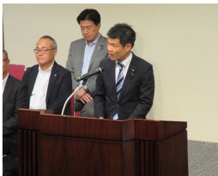
勝俣孝明副大臣による祝辞