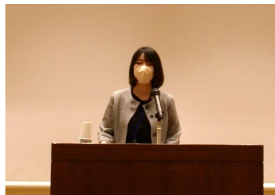
北畠主任技師による研修