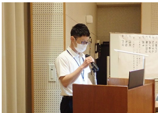
大矢主任による研修