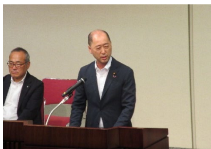
官崎雅夫参議院議員による情勢報告