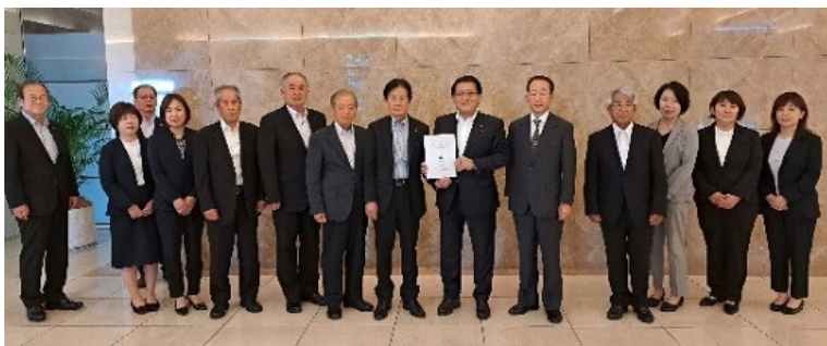
平井卓也衆議院議員に要望書を提出

令和6年度農業農村整備事業関係予算の確保に向け、6月16日に農林水産省並びに県選出国會議員に対して、農業農村整備関係予算の必要額を当初予算で確保すること。「農業用ため池の管理及び保全に関する法律」並びに「防災重点農業用ため池に係る防災工事等の推進に関する特別措置法」に則り、総合的な防災