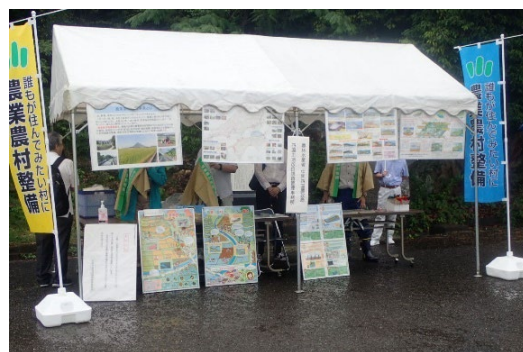
四国土地改良調査管理事務所の展示