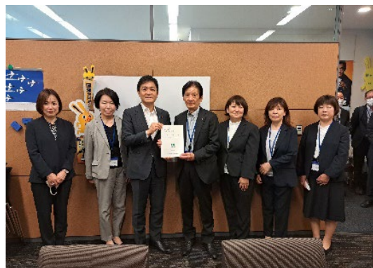
玉木雄一郎衆議院議員に要望書を提出