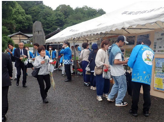
キャンペーンの様子