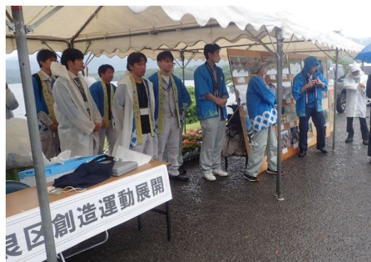
本会と香川県の展示

は、「土地改良施設安全管理推進啓発」のチラシ入りポケットティッシュを満濃池のゆる抜き見学に訪れた方に配布するなどし、土地改良区の役割や農業水利施設の重要性・安全管理等をPRした。