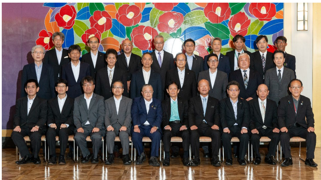
中国四国土地改良事業団体連合会協議会総会出席者