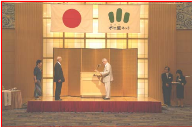
水土里ネット祇園町外二ヶ町

平成 20 年度中国四国土地改良事業団体連合会協議会総会並びに『21 世紀土地改良区創造運動中国四国地方大賞』表彰式が去る 6 月 10 日、高松市浜ノ町「全日空ホテルクレメント高松」において開催された。