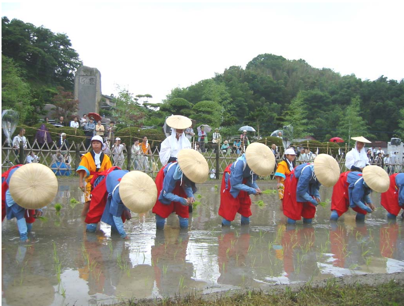
主基斎田お田植まつり（綾歌郡綾川町）