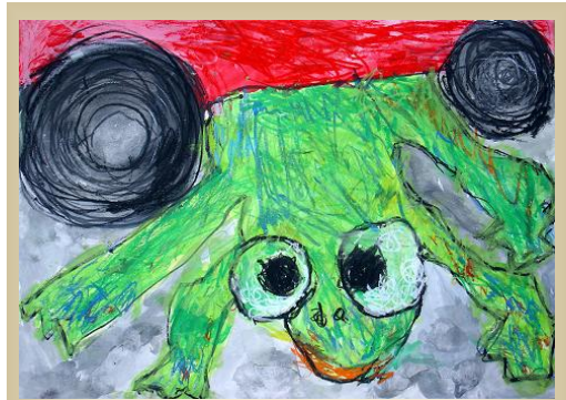
昨年度「環境大臣賞」を受賞した 私立寺井幼稚園の今村君(4才) の作品