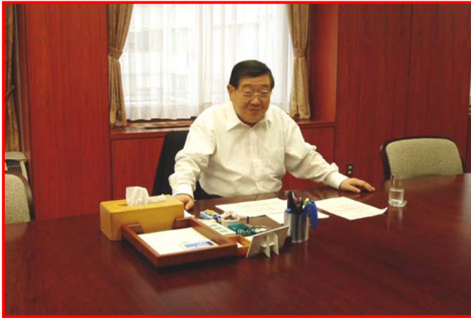
若林農林水産大臣

中国四国土地改良事業団体連合会協議会は 6 月 23 日、農林水産省を訪問し農業農村整備事業施策・制度等に関する提案、下記 8 項目を提出した。