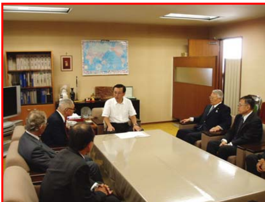
谷垣自由民主党政務調査会長

また、翌 24 日には財務省を訪れ、額賀財務大臣ほか 17 名に、午後からは谷垣自由民主党政務調査会長と面談し、平成 21 年度農業農村整備事業の予算編成に向けた下記 5 項目を要望した。