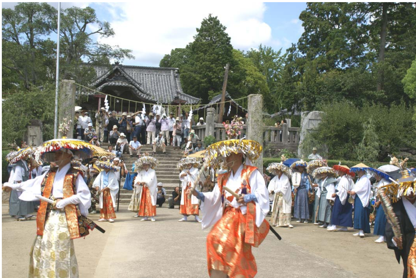
恵みの雨と五穀豊穡を祈願した滝宮念仏踊（綾歌郡綾川町）平成 20 年 8 月 25 日