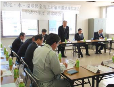
西讃地域協議会（観音寺市）