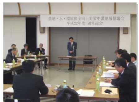
中讃地域協議会（善通寺市）

農地・水・環境保全向上対策の平成 22 年度地域協議会通常総会が、去る 4 月 8 日の西讃地域（会員 8 団体）を皮切りに、9 日は東讃地域（会員 19 団体）、12 日には中讃地域（会員 14 団体）で会員、幹事出席のもと県内 3 地域で開催された。