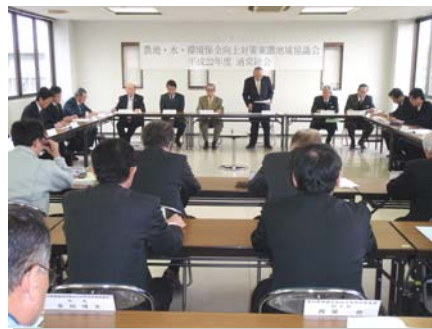
東讃地域協議会（高松市）