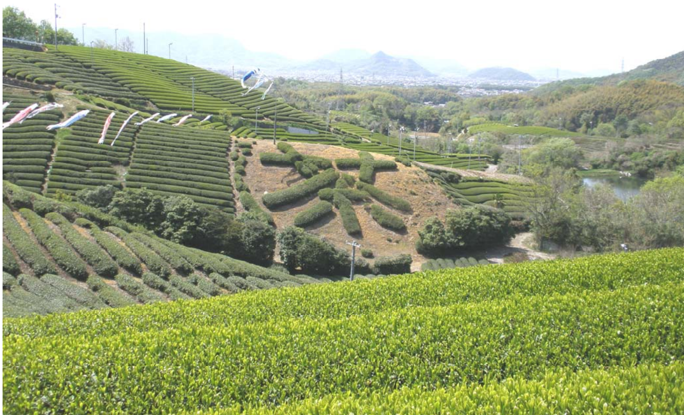
二ノ宮地区の茶畑（三豊市高瀬町）