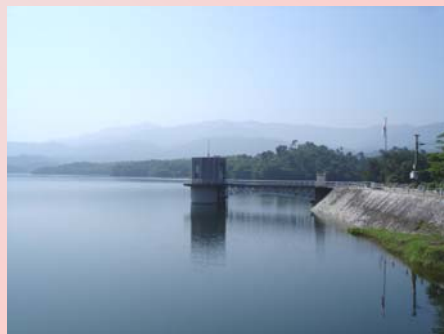
満濃池（まんのう町）