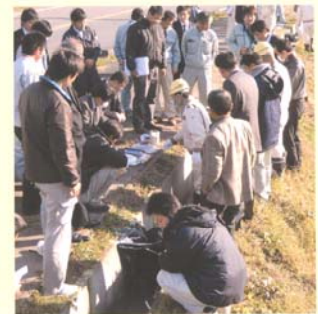
実際の施設を活用し、専門家の指導の下で簡易補修作業を行い、技術を体得できます。 (補修作業を実際に体験出来ますので、作業ができる服装で参加して下さい。) ※本研修は、農業土木技術者継続教育プログラム認定申請を行います。