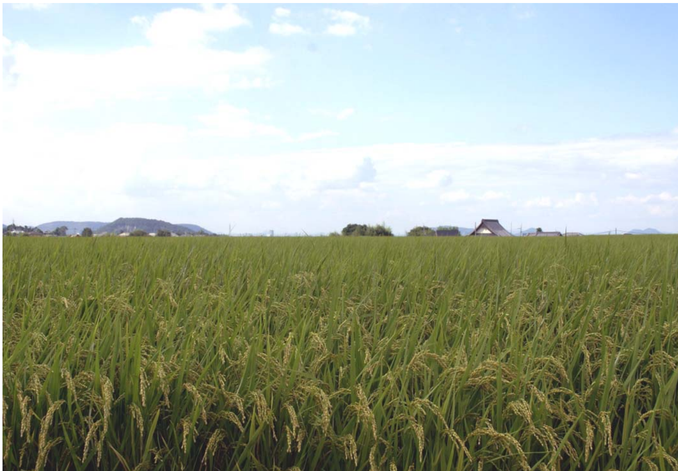
実りの秋（高松市十川東町）

発行所 香川県土地改良事業団体連合会 高松市番町 2 丁目 4 番 27-301 号 TEL (087) 822-0303 FAX (087) 851-1787 http://www.midorinet-kagawa.or.jp/