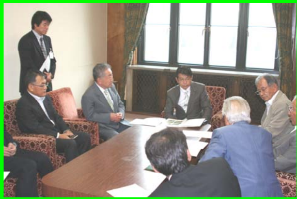
要望要旨を奥田 建 副幹事長(中央)に説明