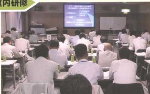
事業内容、制度及びコンクリート構造物の診断と補修方法について専門家による研修を受け、補修に関する基礎知識を得ることができます。