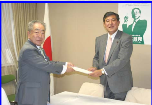
石破 茂 自由民主党政調会長

を構成する要素として、農山漁村活性化のための重要な地域資源である。さらに「食料・農業・農村基本計画」の目標達成のため、平成 22 年度の追加補正予算、平成 23 年度予算の編成について、特段のご配慮をお願いした。