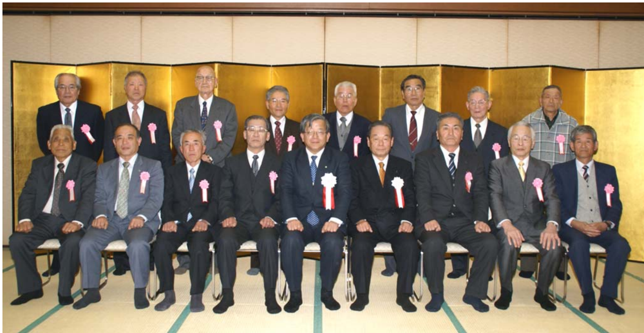
香川県職員表彰者名簿