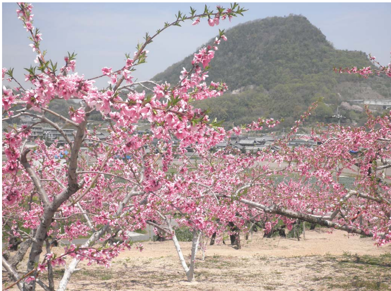
吹毛ノ山の桃畑（三豊市高瀬町）