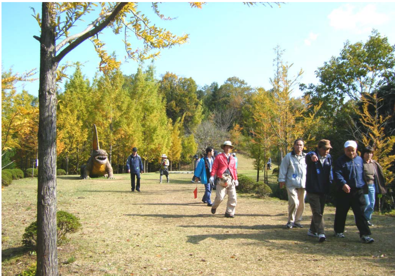
疏水百選「香川用水」水土里の路ウォーキング（三木町・太古の森）