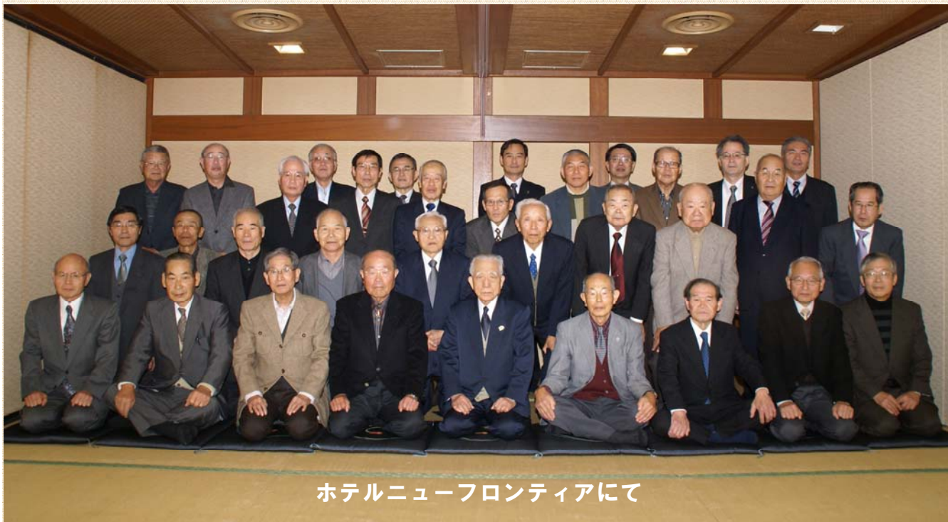
ホテルニューフロンティアにて