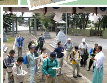
香川用水の役割について説明を聞く