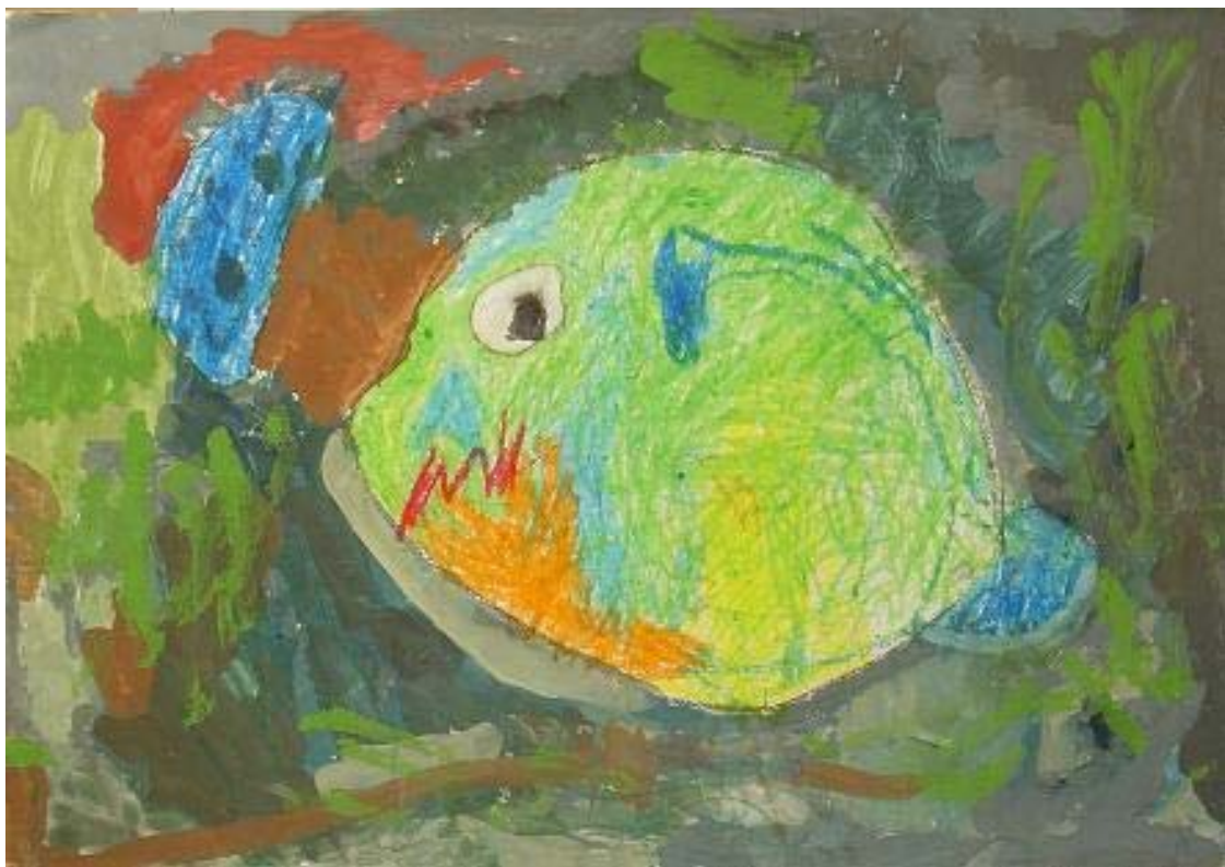
「たんぼのなかのさかな」