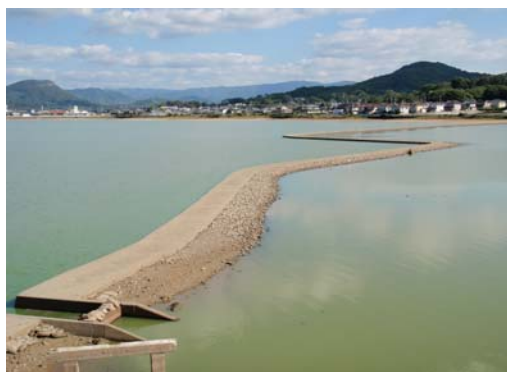
左側が国市池、右側が五丁池

また、管内のうち、下高瀬・吉津地域においては、農業生産の基礎である農地や農業用排水路が県営ほ場整備事業や農業構造改善事業等で概ね整備され、用水路はパイプライン化されており、農業用水の円滑な配水を目指し、幹線水路の適切な維持管理はもとより、パイプライン化のメリットを生かした効率的な配水管理が行われている。なお、厳しい農業情勢ではあるが、芳地理事長をはじめ、土地改良区の役員が一丸となり、農業水利施設の保全管理など、地域農業の振興のために積極的に取り組んでいる。