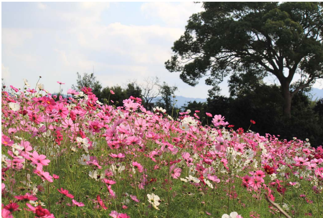
遊休農地に咲く秋桜（高松市東植田町）