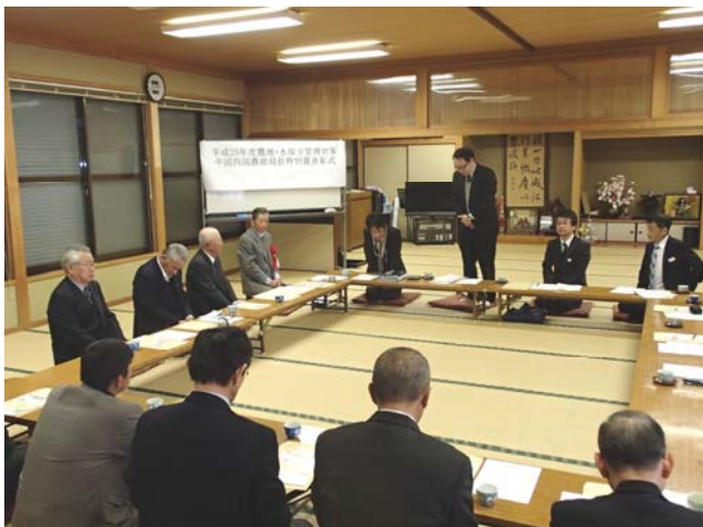
表彰後に行われた意見交換会

また、今年度で 8 年目を迎える保全会から活動状況等の報告後、平成 26 年度から始まる日本型直接支払制度への期待と意気込みなどについて熱心に意見が交わされた。