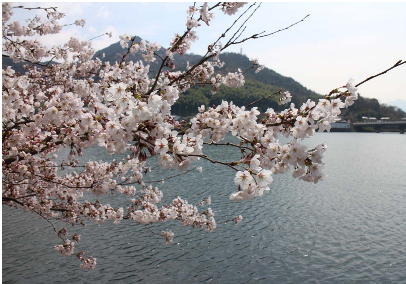
打越池（丸亀市綾歌町）