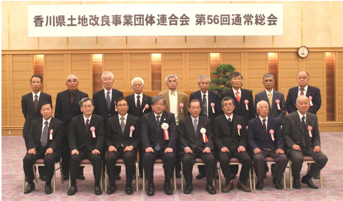
香川県職員表彰者名簿