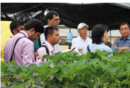
イチゴ農家を見学