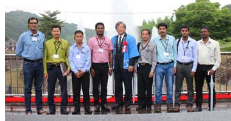
水口祭にて本会の大山会長(中央)と研修生