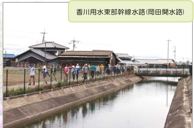
香川用水東部幹線水路(岡田開水路)