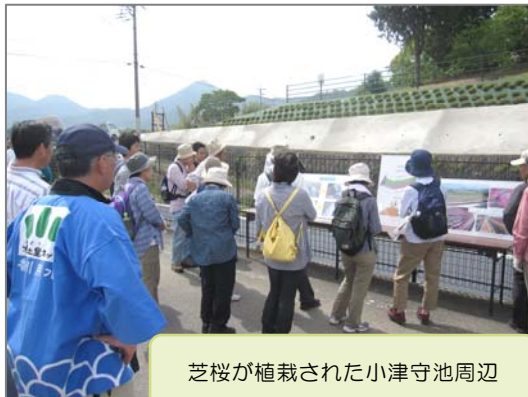
芝桜が植栽された小津守池周辺