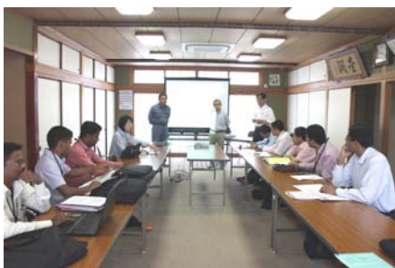
四箇池土地改良区にて研修

本会では、独立行政法人 国際協力機構（JICA）四国支部から委託を受け、「農家組織によるため池を利用した地域の水管理」研修会を実施している。本研修会も今年で5回目となり、本年度は、アジア地域6ヶ国から農業用施設的设计や整備、管理などに携わる技術者8名が来県し、6月2日から約1ヶ月間の日程で香川県の水利開発の歴史をはじめ、ため池や水路など農業水利施設の保全・管理に関する技術、土地改良法や土地改良区の組織とその運営体制などについて研修を受けている。