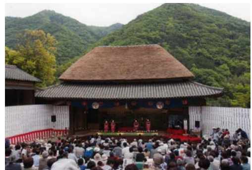
肥土山の農村歌舞伎