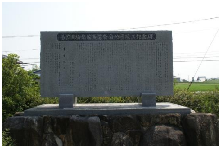
県営圃場整備事業香南地区竣工記念碑

香南町は、香川県のほぼ中央に位置する空港の町であり、昭和・平成の合併により高松市となった。昭和 28 年内場池が完成し、永年の悲願であった常習旱魃地域の由佐・池西・畑田の高台地区が、安原の関井堰より香東川の取水が実現するという奇跡的な恩恵に浴することができた。しかし、この地区は池西幹線水路からは遠く離れ、新水路を敷設しなければ取水することが不可能であった。そのため当改良区の前身である由佐村原土地改良区は、非補助応急旱害対策事業により、農林漁業資金を借り入れ、数個のため池が一丸となり、昭和 32 年度に由佐南部水路を新設した。昭和 61 年新高松空港建設により、周辺整備構想が策定され約 110ha の農地が県営圃場整備に計画され、事業推進のため同年 10 月香南南部土地改良区が設立された。地形は南高北低、東西が筋状の谷間の多い水系地形を配慮して、地域内を 6 工区に分画して、工区毎に農林漁業資金を借り入れ、償還も換地配分も工区毎の独立採算制として、工区内の諸案件はすべて工区が全責任を以て対処することとした。起債も繰り上げ償還を督促し、事業完成記念式典時には、各工区共に借金ゼロの快挙を成し遂げたのである。地形は前記の如く、30 万 m 3 余の残土埋め立て、地区は第 1・4・6 工区、5 万 m 3 前後の埋め立て地区も数ヶ所に及んだ由佐地区の第 1・2・3 工区は、管内小ため池が多く協議を重ね、数ヶ所のため池を埋め立て水利統合して、工区毎の 1 水系として理想の圃場とパイプラインの近代化を完備した。平成 17 年高松市の合併に伴い、香南南部・香南パイロット・音谷池の 3 改良区の統合及び改良区非組合員を加えて、平成 17 年 11 月香南町土地改良区を設立して町内 1 改良区として、各種土地改良事業に取り組み組合員の要望に答えている。また、平成 19 年度からスタートした農地・水環境保全向上対策には 5 組織の自然保護組合が、平成 26 年度からは、多面的機能支払交付金制度を機に平成 27 年度には 7 組織の合併を促進し、香南地区自然保護組合として再スタートした。その事務の一部を改良区が受託し活動の適正かつ円滑な運営に寄与している。