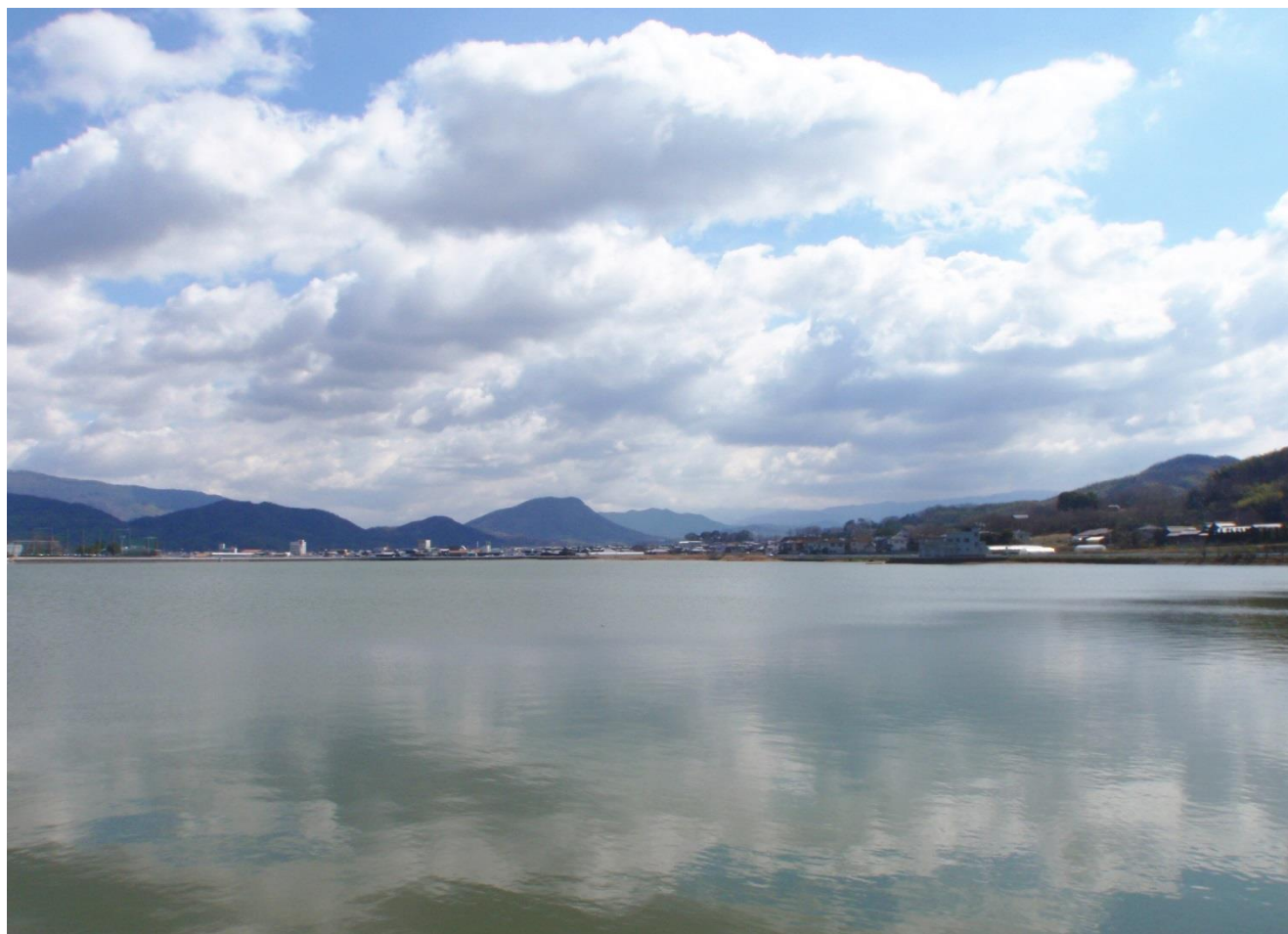
「ため池百選」に選定された国市池（三豊市高瀬町）

発行所 香川県土地改良事業団体連合会 高松市番町 2 丁目 4 番 27-301 号 TEL (087) 822-0303 FAX (087) 851-1787 http://www.midorinet-kagawa.or.jp/