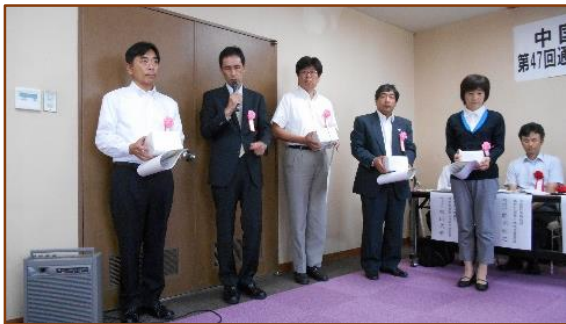
永年勤続表彰者の 5 名