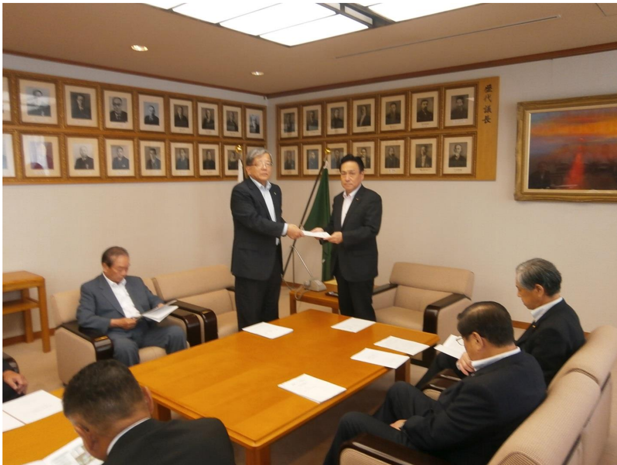
香川県議会辻村議長に要請

8 月 6 日、本会の大山会長をはじめ、組橋副会長、三笠副会長ら役員 5 名が会員を代表して香川県議会を訪れ、農業農村整備事業の計画的な推進を図るため、県予算の確保等について要請活動を行った。