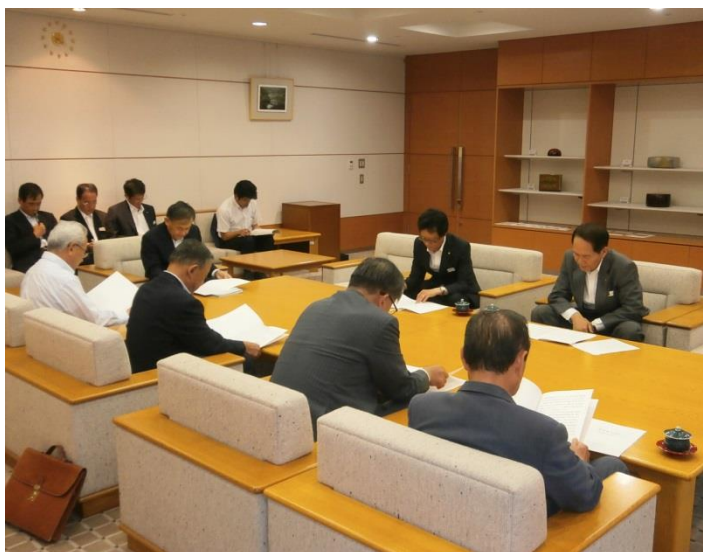
浜田県知事に要請