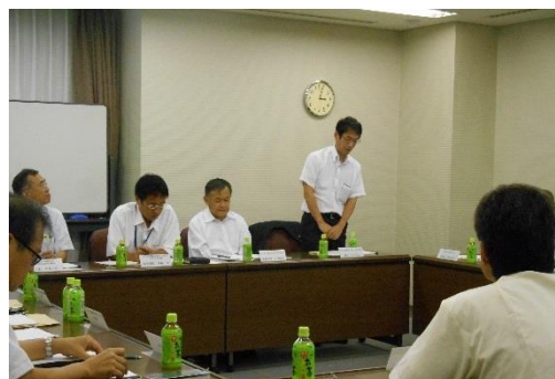
挨拶をする小山課長