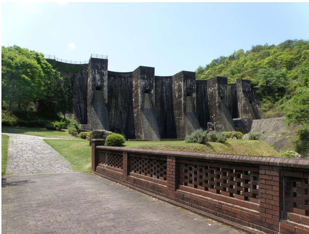
豊稔池（観音寺市大野原町）