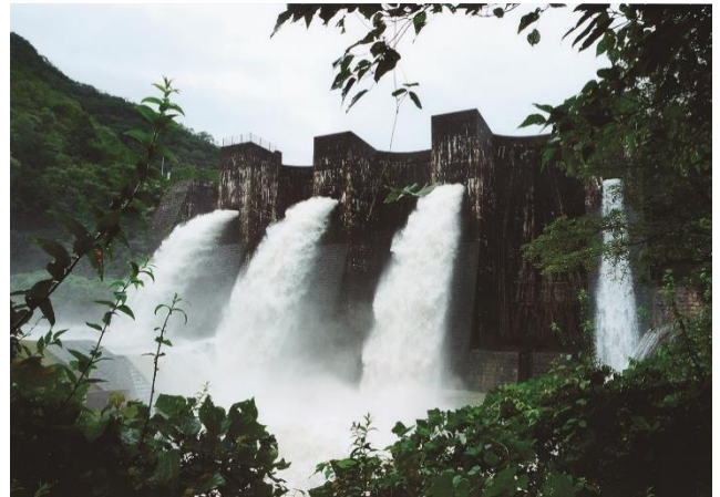
特別賞「自然放水」 豊稔池（香川県観音寺市）