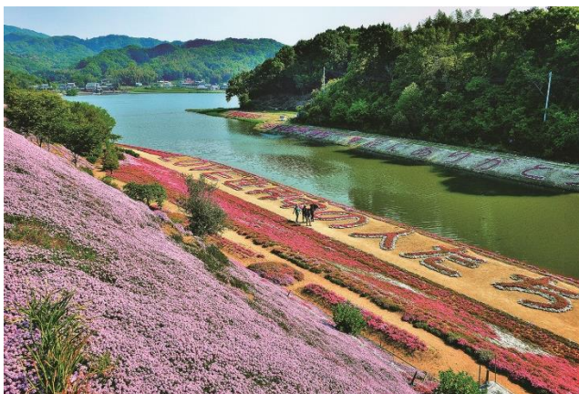
特別賞「芝桜咲くため池」 神内池（香川県高松市）