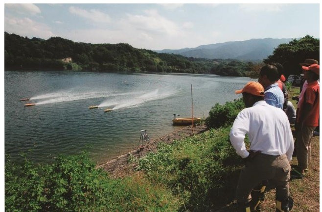
特別賞「ガンバレー!!」 大谷池（香川県観音寺市）