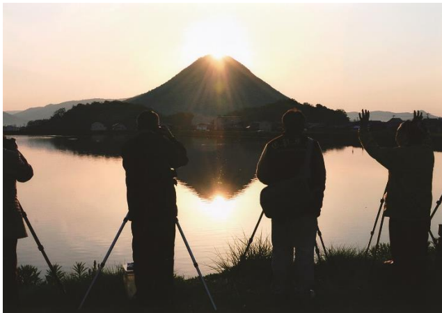
特別賞「ダイヤモンド讃岐富士に魅せられて」 宮池（香川県丸亀市）