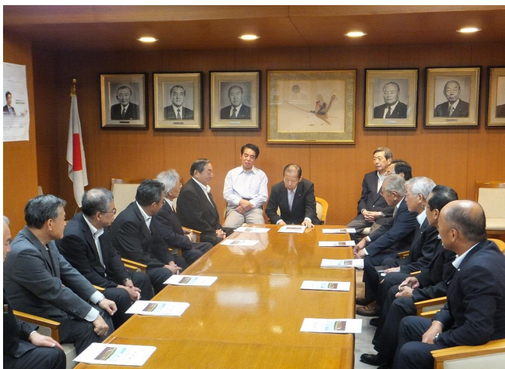
二階俊博自由民主党幹事長に要請書を提出

なお前日 4 日、本会の山地常務理事は、県選出の国会議員に対し、本県が抱える喫緊の課題の解決に向け、「農業農村整備関係予算の拡大・確保、(農村地域防災減災事業、多面的機能支払交付金事業)、土地改良区体制強化事業の支援拡大」などについて要望活動を行った。