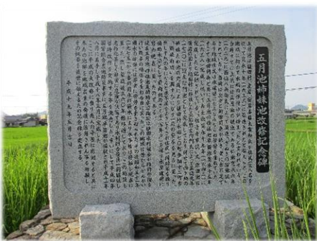
五月池姉妹池改修記念碑