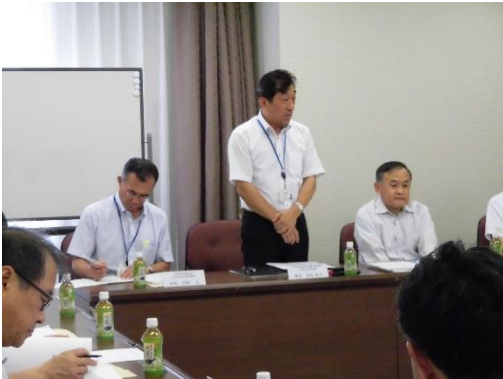
島尾農政局土地改良管理課長による挨拶

7月12日、高松商工会議所において、香川県管理運営体制強化委員会を開催した。この体制強化委員会は、平成28年度から土地改良区体制強化事業が実施されることに伴い、土地改良区の円滑な管理運営を推進するため、施設・財務管理強化対策及び研修・人材育成、土地改良事業に関する苦情・紛争等対策の内容について検討を行うことを目的に、新しく本会に設置された。新しい強化委員のもと、委員長及び委員長職務代理者が選任され、土地改良区運営の在り方などについて協議した。また、協議事項については、すべて原案どおり承認された。