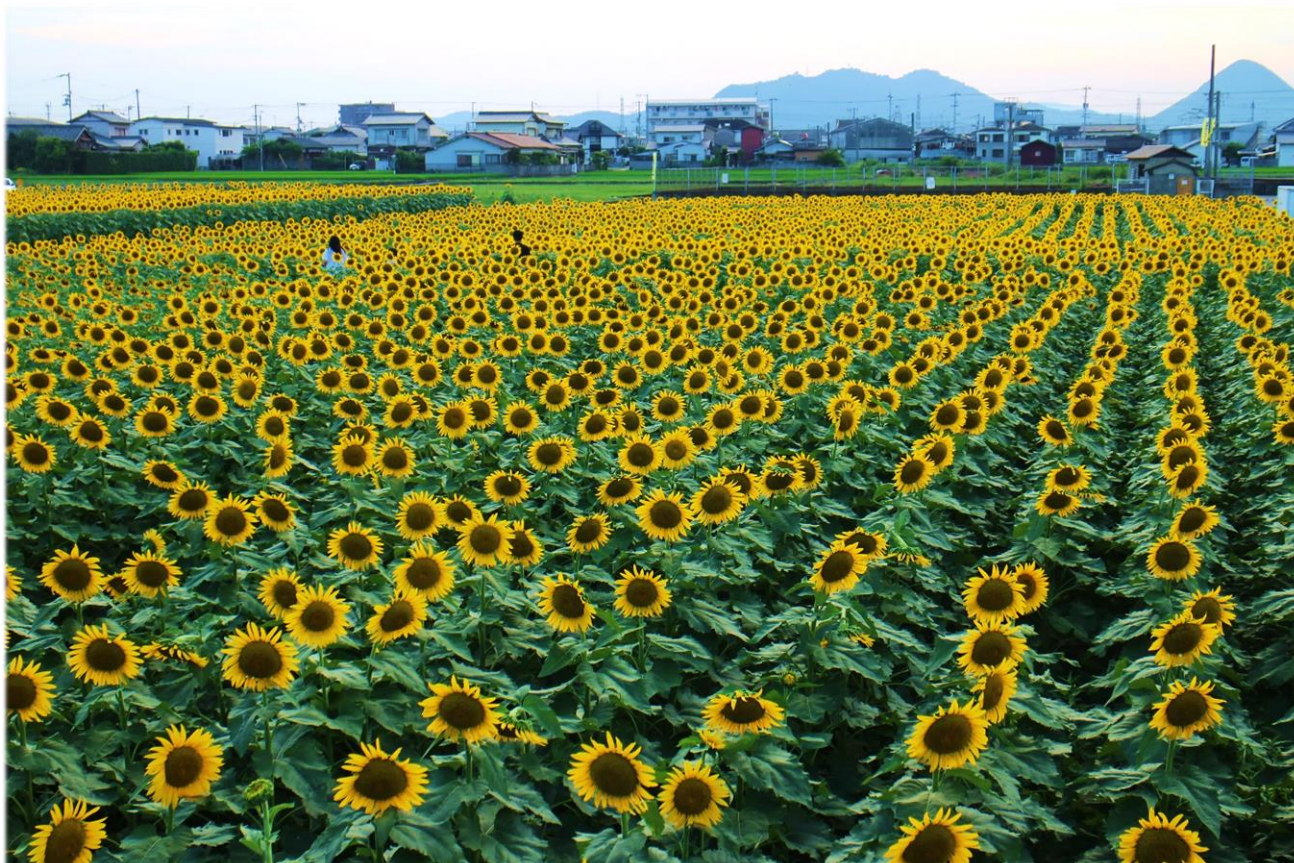
ひまわり畑（高松市仏生山町）