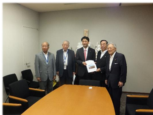
進藤参議院議員に要請