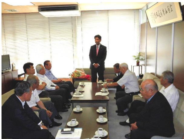
参議院議員進藤かねひこ氏を囲んで懇談

7月27日、本会役員室において、先の参議院議員選挙で土地改良代表として初当選された進藤かねひこ氏を来賓に招き、土地改良区体制強化事業に係る支援会議を開催した。