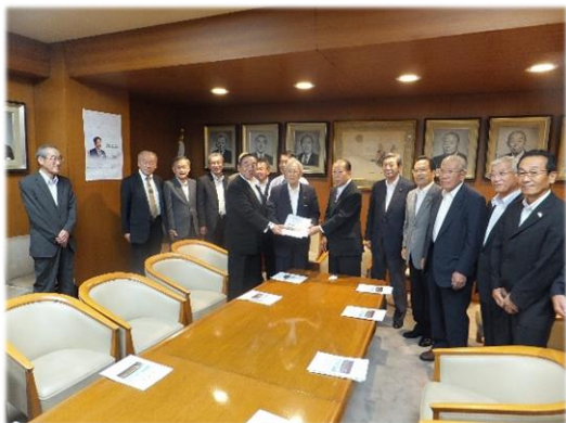
二階自由民主党幹事長に要請