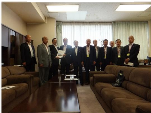
室本農林水産省農村振興局次長に要請