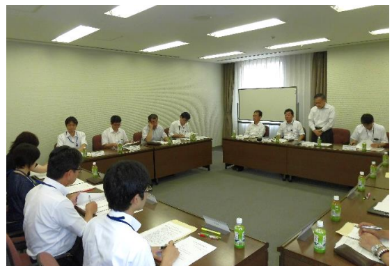
山地本会常務理事による挨拶

7月12日、高松商工会議所において、香川県受益農地管理強化委員会を開催した。この管理強化委員会は、平成28年度から土地改良区体制強化事業が実施されることに伴い、換地事務に関する指導並びに異議紛争の未然防止・早期解決、また農地の効率的利用を図ることを目的に、新しく本会に設置された。新しい強化委員のもと、委員長及び委員長職務代理者が選任され、換地及び農地の利用集積に係る諸課題について検討を行い、担い手の育成や規模拡大に向けた施策等について協議した。また、協議事項については、すべて原案どおり承認された。