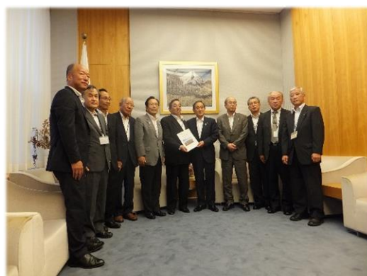
菅内閣官房長官に要請