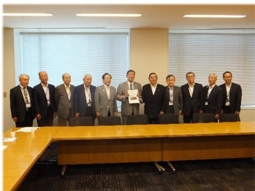
石破衆議院議員に要請