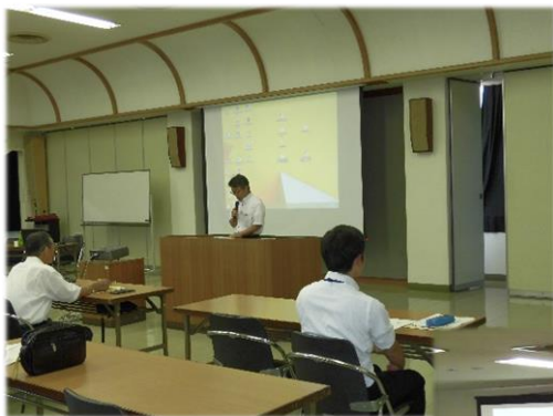
9 月 2 日 中讃会場