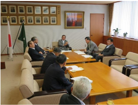
香川県議会で意見交換

そして、ため池の防災・減災対策関係予算、多面的機能支払の活動状況、単独県費補助土地改良事業の実施状況等について意見交換を行った。