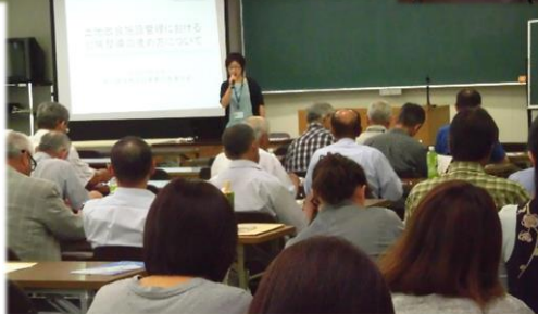
9 月 7 日 東讃会場