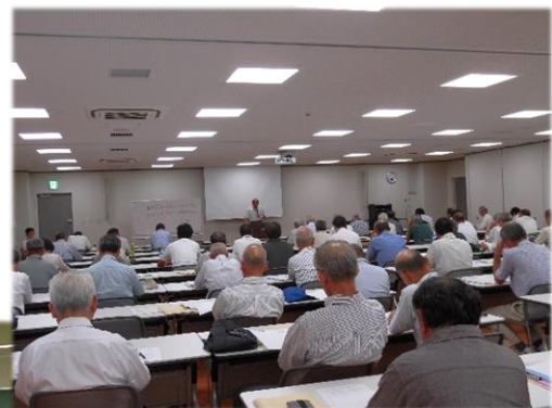
9 月 5 日 西讃会場