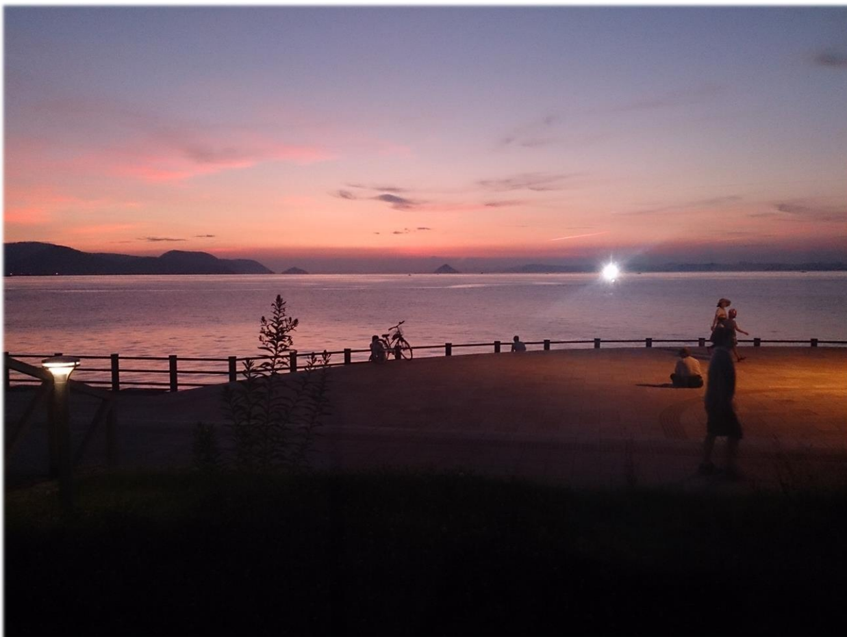
瀬戸内海の夕日（高松市）