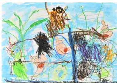
「カエルとおたまじゃくしが遊んでいるよ」 西村琉輝耶（3 歳）