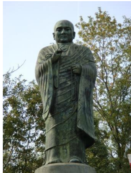
満濃池を見おろす空海像