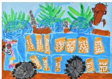
「おいしそうなおこめ」 氏家亜麻音（6 歳）

全国水土里ネットと各都道府県水土里ネットが主催する「ふるさとの田んぼと水」子ども絵画展は、今年で 17 回目を迎え、子どもたちに絵画を通じて農業農村の魅力をアピールすることを目的に開催している。今年は、全国から 7,879 点の応募があり、厳選な審査の結果、県内からは、高松市の敬愛保育園の氏家亜麻音さん（6 歳）が描いた「おいしそうなおこめ」をはじめ、10 点の作品が入選した。