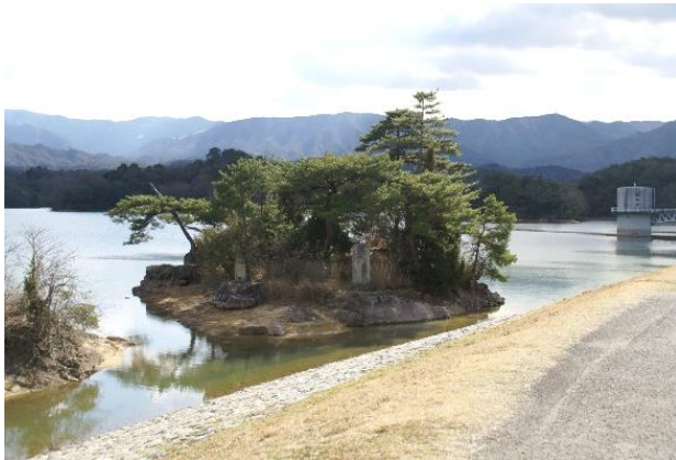
工事の無事を祈った護摩壇岩

『日本記略』の弘仁十二年七月の記述に、「新銭二万を空海法師に施す」とあります。これは朝廷が空海に、満濃池修築の恩賞を施したものです。