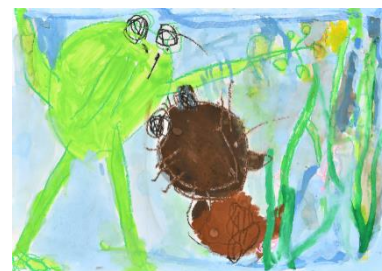
「田んぼでカエルがピョン」 喜多充城（4 歳）