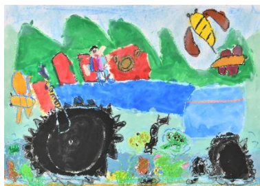
「トラクター」 前川空翔（5 歳）