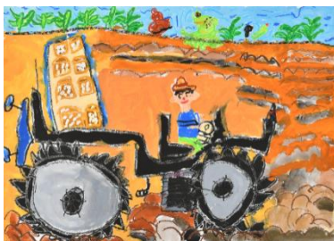
「つちをたがやすトラクター」 小野亜翔（6 歳）