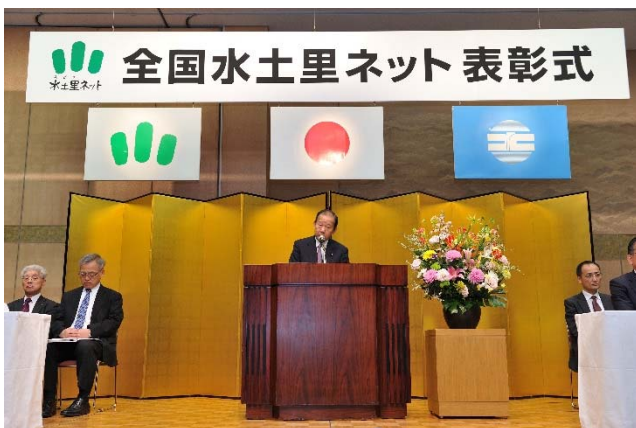
全国水土里ネット表彰式で挨拶をする二階会長

続いて、山本農林水産大臣の祝辞の後、表彰状授与式が行われ、農林水産大臣表彰として全国土地改良功労者等表彰 5 土地改良区及び農業農村整備優良地区コンクール 2 地区、また農林水産省農村振興局長表彰としてそれぞれ 2 土地改良区及び 4 地区、そして全国水土里ネット会長賞として金章 38 土地改良区、銀章 49 土地改良区、銅章 27 土地改良区、個人表彰として 116 名が晴れの栄誉を受けた。本県からは、金章に高松市牟礼町土地改良区、銀章に大窪池土地改良区、観音寺市大谷池土地改良区、銅章に高松市塩江町土地改良区、丸亀市飯山町土地改良区、