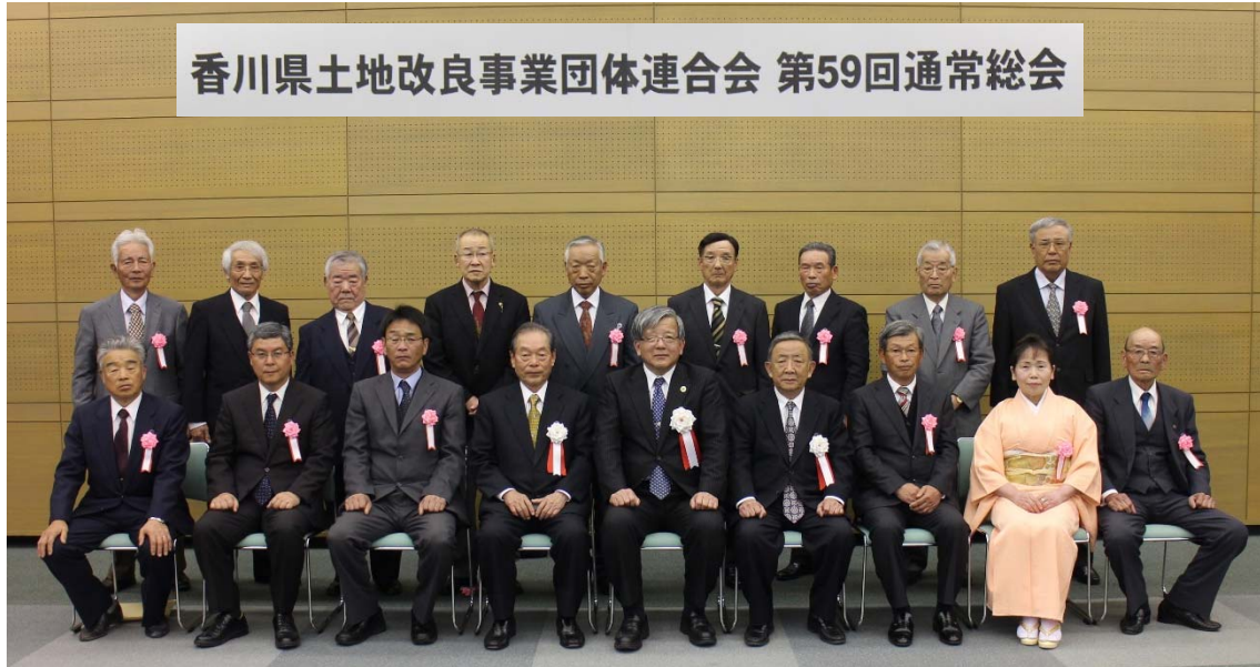
香川県職員表彰者名簿