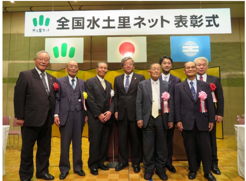
表彰式に出席された方々

冒頭、全国土地改理事業団体連合会の二階会長は、受賞者の長年にわたる土地改良事業や土地改良区の運営に寄与されたお礼とお祝いを述べるとともに、今後とも土地改良事業の推進と地域振興にご尽力を賜われますようお願い申し上げますと挨拶された。