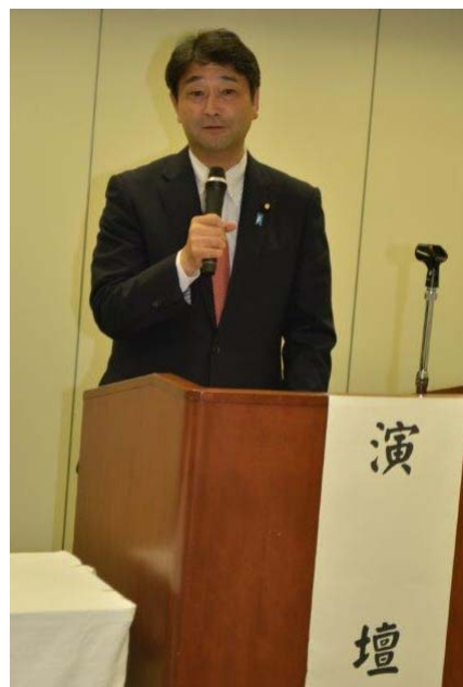
挨拶をされる進藤副会長 (会長職務代行者)