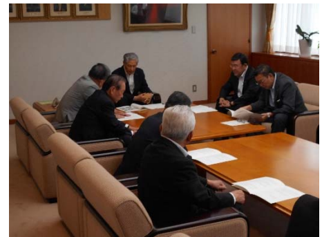
香川県議会での意見交換