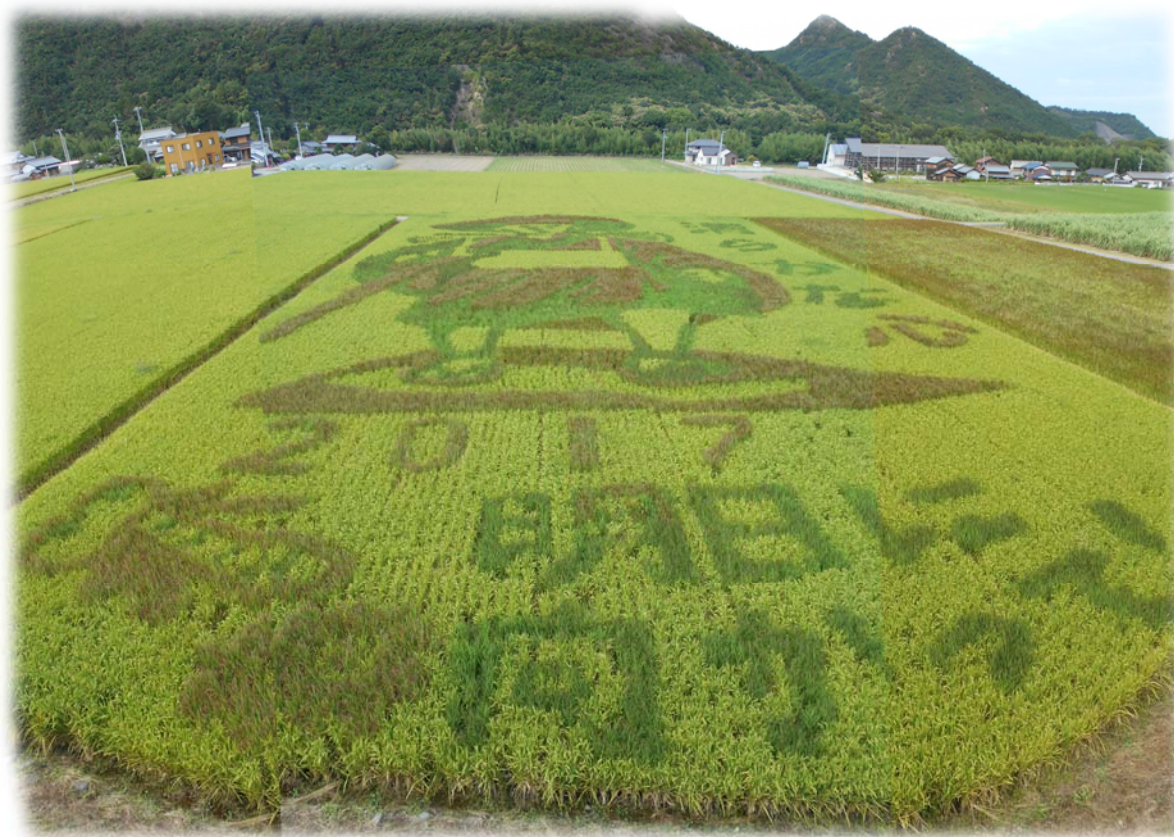
空ちゃん田んぼ（東かがわ市）

発行所 香川県土地改良事業団体連合会 高松市番町五丁目 1 番 29 号 TEL (087) 832-7140 FAX (087) 832-7150 http://www.midorinet-kagawa.or.jp/