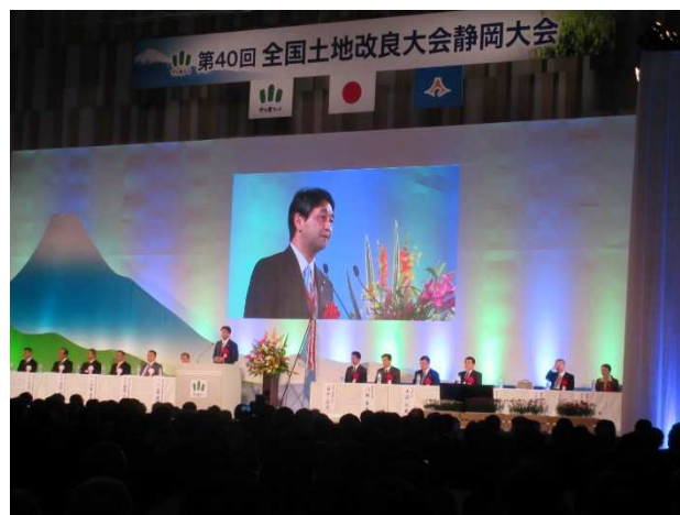
祝辞を述べる進藤金日子参議院議員