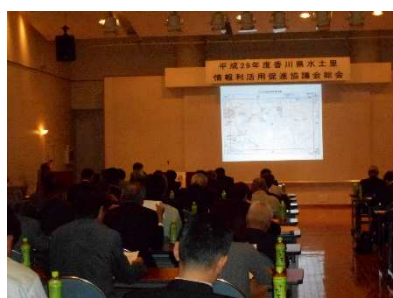
G I S 活用事例紹介