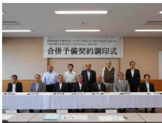
調印式後の記念撮影