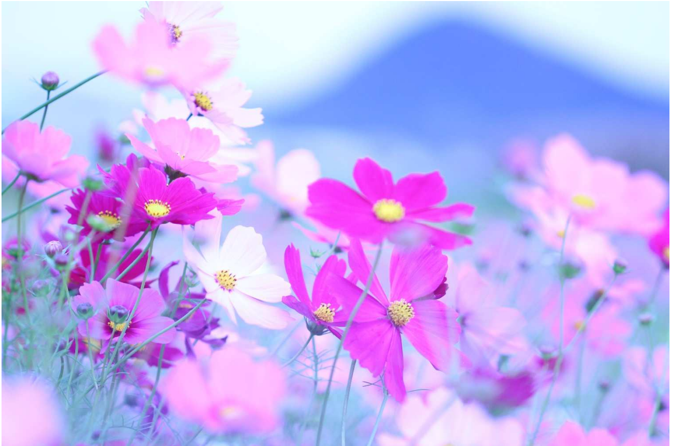
秋桜と飯野山（丸亀市飯山町）

発行所 香川県土地改良事業団体連合会 高松市番町五丁目 1 番 29 号 TEL (087) 832-7140 FAX (087) 832-7150 http://www.midorinet-kagawa.or.jp/