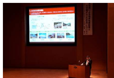
地表地震断層についての講演