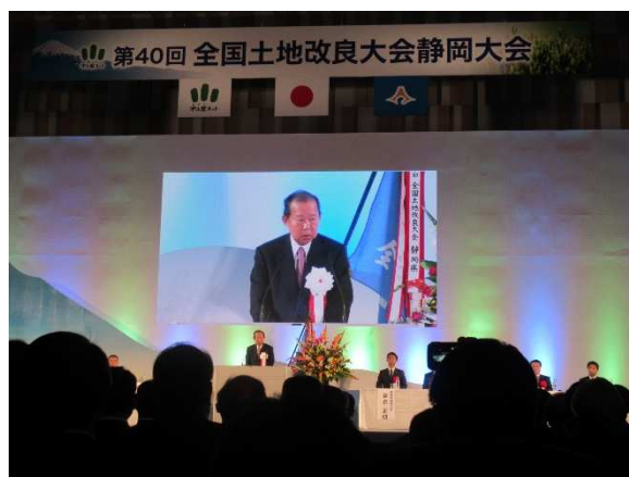
全国水土里ネット 二階俊博会長