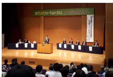
フォーラムの様相

ため池が多く存在する本県においても、南海トラフ巨大地震の発生が懸念されるなか防災減災の参考となる取り組みや、地域住民を巻き込んだ環境保全活動など、参考となる事例が多数紹介され有意義なフォーラムであり、今後の本会運営においても是非参考とさせていただく。