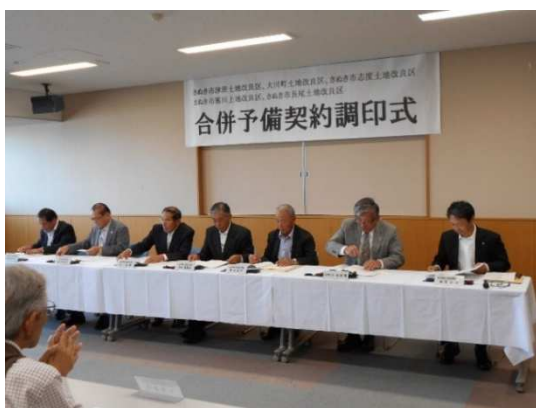
合併予備契約書への署名・捺印

今後、今年中の正式合併に向け、各種協議が引続き行われるが、今回の合併予備契約の調印によりこれら調整が一層加速していくことが見込まれる。