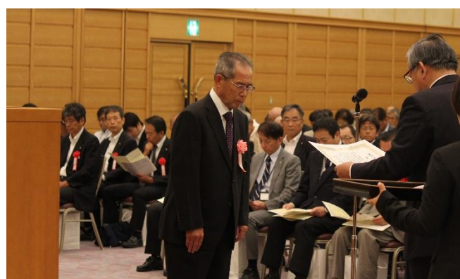
会長表彰（永年勤続）本会職員 受賞式