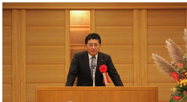
平井卓也衆議院議員より祝辞