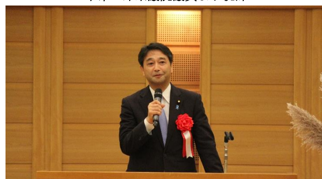
進藤金日子参議院議員より祝辞