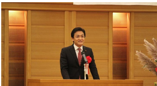
玉木雄一郎衆議院議員より祝辞