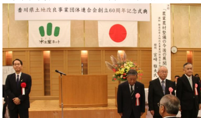
香川県知事表彰（感謝状）受賞式