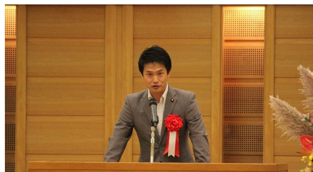
小川淳也衆議院議員より祝辞