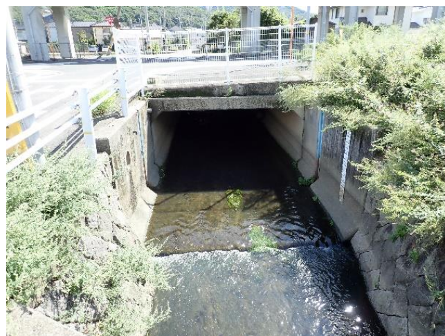
権吉川のゲートで用水取水していた跡