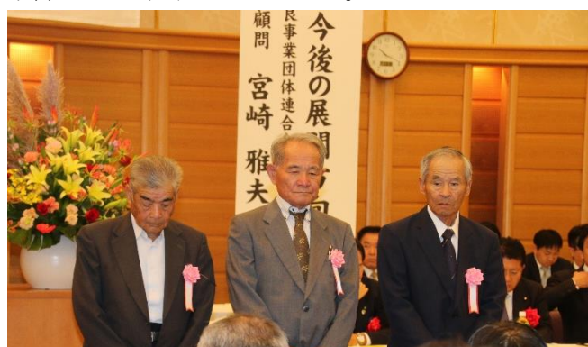
会長表彰（感謝状）受賞式