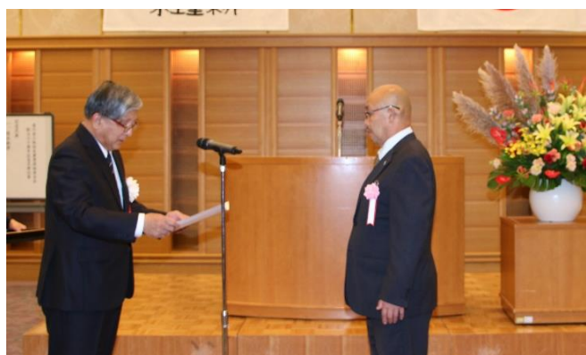
会長表彰（土地改良功労）受賞式